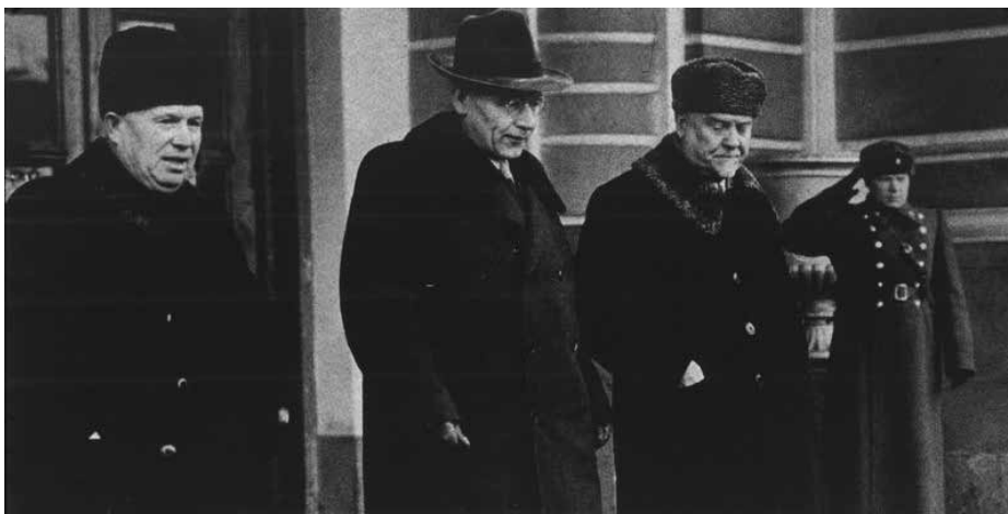
HRUSCISOV, GOMULKA ÉS BULGANYIN, 1956.

Furcsa helyzet áll elő. Kádár hiába van többségben az Elnökségben, Nagy