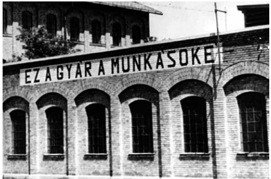
ILYEN IS VOLT...

nemzetiségi problémákat, így a külföldi magyarság gondjait sem, de enyhítette őket. A szocializmusban az adott ország feladata volt a nemzetiségek jogainak biztosítása, kinek-kinek a saját szülőföldjén. A történelmi sebekről nem beszélt, ugyanakkor világossá tette, hogy magyar és román, magyar és szlovák nem akkor fog jobban élni, ha gyűlölik egymást, hanem akkor, ha mindenütt nő a gazdaság teljesítménye, emelkedik az életszínvonal.