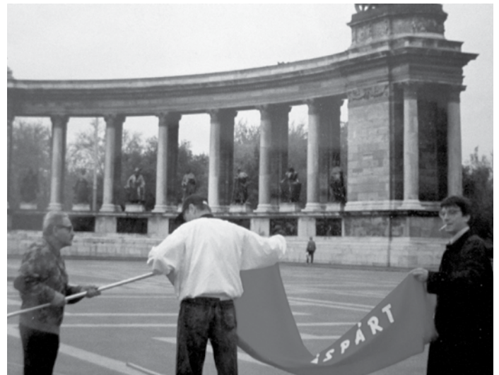
MUNKÁSPÁRTI GYÜLÉS ELŐKÉSZÜLETEI A HŐSÖK TERÉN

A Munkáspárt részt vett minden parlamenti és önkormányzati választáson. A választási munka új volt a párt számára, és hosszú idő kellett annak megtanulásához, hogy mit jelentenek a tőkés választások, és hogyan kell azokon küzdeni. A párt e téren jelentős gyakorlatra tett szert. Ugyanakkor nem vettük eléggé figyelembe, hogy a parlamenti választáson való részvétel azt jelenti, hogy mi a tőkés erők által választott terepen, az ő szabályai szerint játszunk. Ez eleve korlátozza a lehetőségeinket. Még a legnagyobb parlamenti sikereket elérő külföldi pártok (ciprusi AKEL, Orosz KP, Görög KP) tapasztalata is azt mutatja, hogy önmagában a parlamentben nem lehet sikert elérni, csak akkor van eredmény, ha a parlamenti munkát összeköti az utcai küzdelemmel.