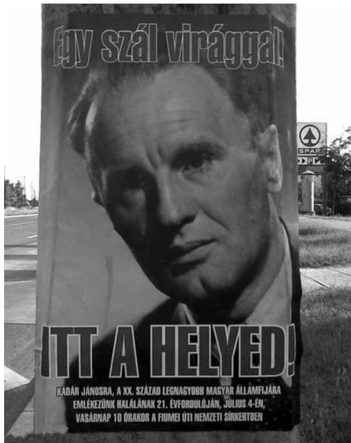
A MUNKÁSPÁRT SOHASEM TAGADTA MEG KÁDÁR JÁNOST

a megszokás hatalma. Megtanulunk, megszokunk bizonyos módszereket, és azt gondoljuk, hogy azokat az idők végezetéig lehet használni. Nehezen tudjuk elfogadni, és főleg megtanulni az újat. Vannak persze szinte örökérvényű módszerek, de az általános tapasztalat más: új helyzet, új stratégia, új taktika. ■