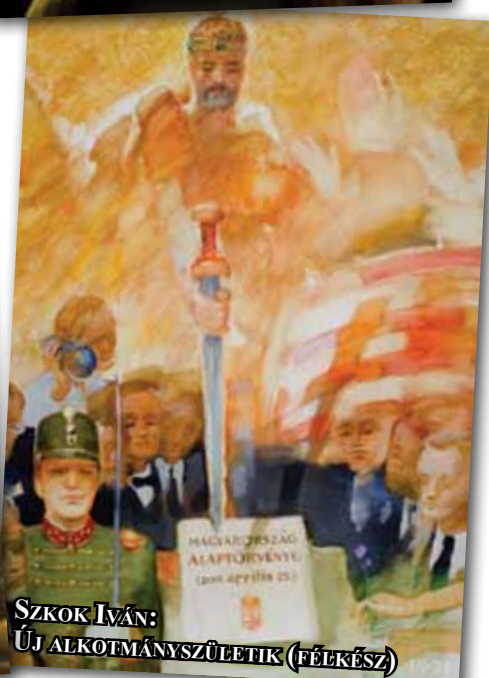
SZKOK IVÁN: ÚJ ALKOTMÁNYSZÜLETIK (FÉLKÉSZ)

A Magyar Kommunista Munkáspárt központi politikai lapja. Szerkeszti a szerkesztőbizottság.