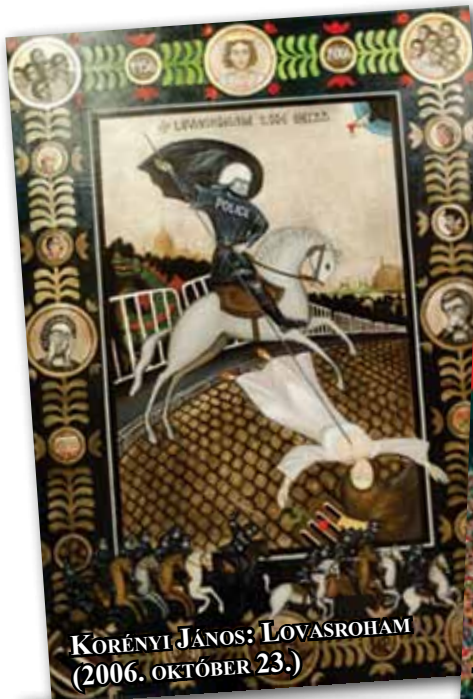
KORÉNYI JÁNOS: LOVASROHAM (2006. OKTÓBER 23.)