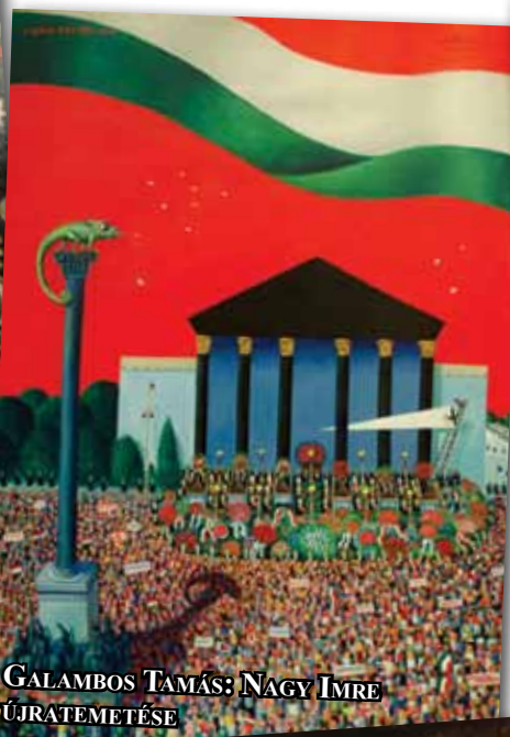
GALAMBOS TAMÁS: NAGY IMRE ÚJRATEMETÉSE