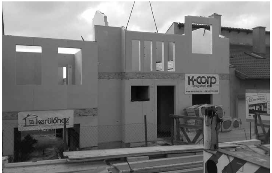
Lakásépítések alakulása Magyarországon

A korábbi időszakhoz hasonlóan a lakásépítéseknek és az építési