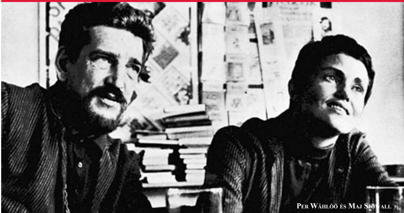
PER WÄHLÖÖ ÉS MAJ SJÖWALL

A kapitalista társadalmat baloldalról kritizáló irodalomért nem kell messzire mennünk: a skandináv krimi-boom nem csak rejtélyes gyilkosságokat, hanem a jóléti államot kíméletlenül bíráló írók hangját is elhozta nekünk.