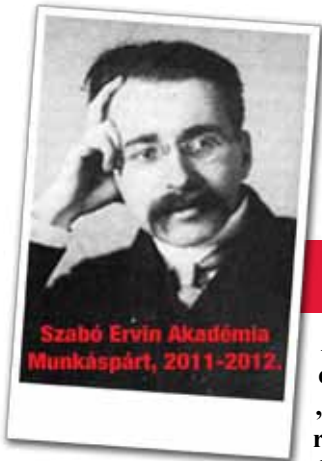
Szabó Ervin Akadémia Munkáspárt, 2011-2012.