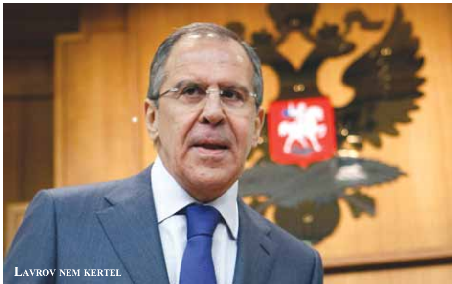
LAVROV NEM KERTEL

Lavrov szerint a szíriai konfliktusból csak egy kiút van, az ENSZ Alapokmányában foglalt elvek, azaz az ország területi egységének tiszteletben tartása és a belügyekbe való be nem avatkozás. Emlékeztetett arra, hogy a