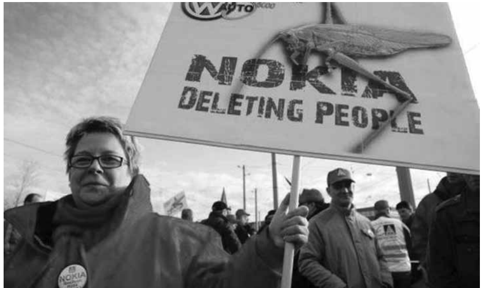
NÉMETORSZÁGBAN MÁR TŰNTETTEK A PARAZITA-TŐKE ELLEN

európai piacért eddig felelős osztrák telephely októbertől a nyugati régióhoz tartozik majd a vállalat belső szervezetében, és egy finnországi központ irányítja majd.