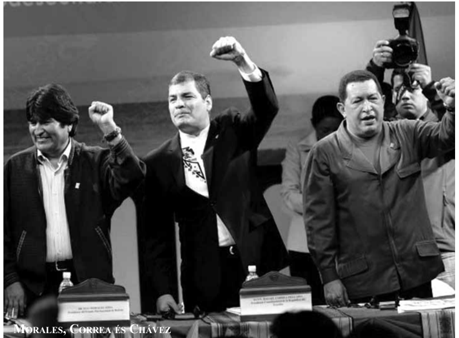
MORALES, CORREA ÉS CHÁVEZ

Hugo Chávez hétfőn „radikális válaszlépésekkel” fenyegette meg Nagy-