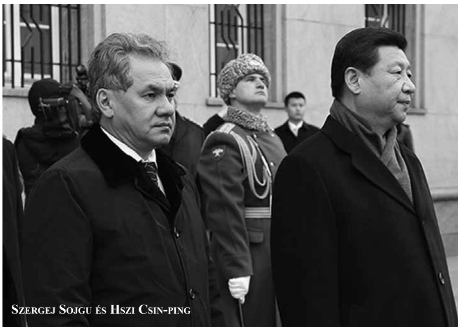
SZERGEJ SOJGU ÉS HSZI CSIN-PING

Az Új Kína hírügynökség március 30-i kommentárja szerint a KNDK bejelentése a „hadiállapotról” azt követően következett be, hogy az USA B-52-es hadászati nehézbombázókat és B-2-es lopakodó repülőgépeket küldött Dél-Koreába, vagyis a felelősség nem kenhető Észak-Koreára. Kína szerint egyelőre nem kell valószínűsíteni a háborútól tartani. Felszólította az USA-t és a KNDK-t, hogy „mindkét fél tegyen hátrafelé egy lépést, és engedje érvényesülni a józanabb szemléletet a helyzet további eszkalációja helyett”.