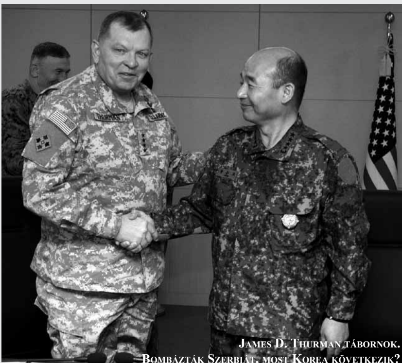
JAMES D. THURMAN TÁBORNOK.

Slobodan Cikaric felhívta a figyelmet arra, hogy 2008-ban - vagyis a lappangás időszakának elteltével - Szerbiában (Koszovót leszámítva) két százalékkal több rákos megbetegedést regisztráltak, mint 2001-ben. A 2010-es adatokat a két évvel korábbiakkal összevetve pedig 10 százalékkal emelkedett az újonnan diagnosztizált daganatos esetek száma. Az orvos úgy értékelte, hogy Szerbia több milliárd dollárnyi kártérítést követelhetne azoknak a tengerészeknek a példájára, akik két-két millió dollár fájdalomdíjat kaptak a fukusimai sugárzás miatt.