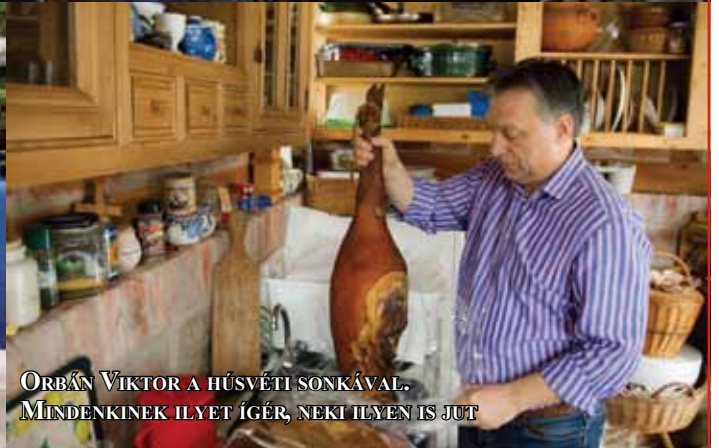
ORBÁN VIKTOR A HÚSVÉTI SONKÁVAL. MINDENKINEK ILYET ÍGÉR, NEKI ILYEN IS JUT