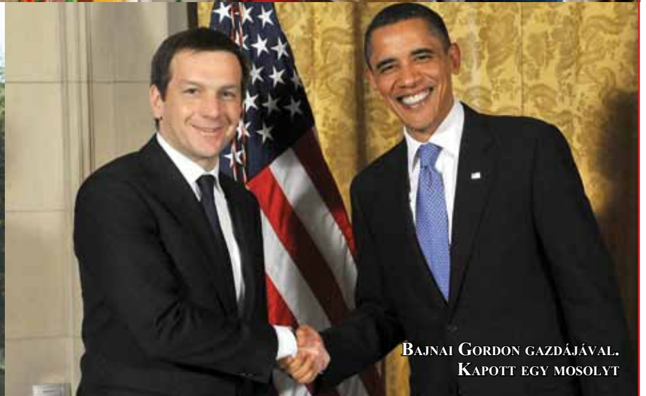
BAJNAI GORDON GAZDÁJÁVAL. KAPOTT EGY MOSOLYT

A Magyar Kommunista Munkáspárt központi politikai lapja. Szerkeszti a szerkesztőbizottság.