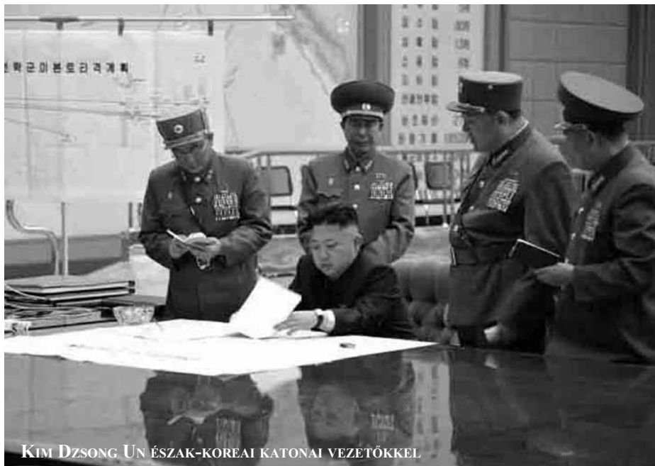
KIM DZSONG UN ÉSZAK-KOREAI KATONAI VEZETŐKEL

Az amerikaiak jó filmrendezők, és azt is tudják, hogy a politikában is kell katarzis. Kell egy olyan nagy közös élmény, amely értelmileg és érzelmileg is összerázza, újfajta cselekvésre készíti az országokat. Ilyen volt Jugoszlávia az 1990-es években, vagy a 2001. szeptemberi robbantás New Yorkban. Líbia már nem rázta meg a világot, Afganisztán sem, vélhetően Szíria esete sem. Iránt évek óta kerülgetik, s valószínűleg nem mondtak le róla, de Irán olyan falat, amely könnyen a torkukon akadhat. Egy észak-koreai