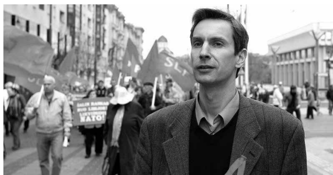
ALGERDIS PALECKIS, A LITVÁN SZOCIALISTA NÉPFRENT VEZETŐJE