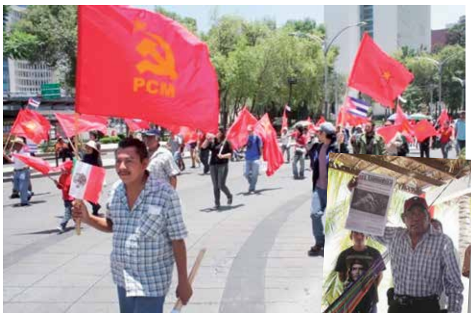
A megtalált holttestekben felismerték a Mexikói Kommunista Párt Guerrero