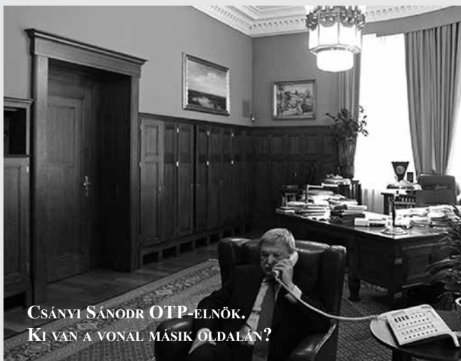
CSÁNYI SÁNDOR OTP-ELNÖK. KI VAN A VONAL MÁSİK OLDALÁN?

forintot akar bankja saját automatájából (ATM) felvenni, a tranzakciós illeték bevezetése előtti átlagosan 103 forint helyett ösztől 514 forintot kell kifizetnie. (Egy rosszul megválasztott bankszámla esetében 1200 forint is lehet ez a költség.)