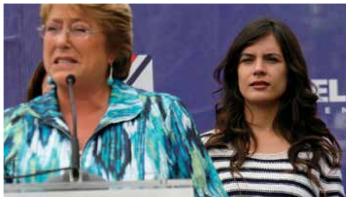
MICHEL BACHELET ÉS CAMILA VALLEJO A CHILEI DIÁKMOZGALOM KOMMUNISTA VEZETŐJE

A 62 éves Bachelet fölényesen nyerte a november 17-i első fordulót: a szavazatok 46,7 százalékát kapta. Fő ellenfele, a 60 esztendő, jobboldali Evelyn Matthei csak 25,2 százalékot szerzett, a további hét jelölt pedig messze elmaradt tőlük. Hiába kapott azonban csaknem kétszer annyi szavazatot Bachelet, mint Matthei, újabb fordulót kellett tartani, mivel a törvény