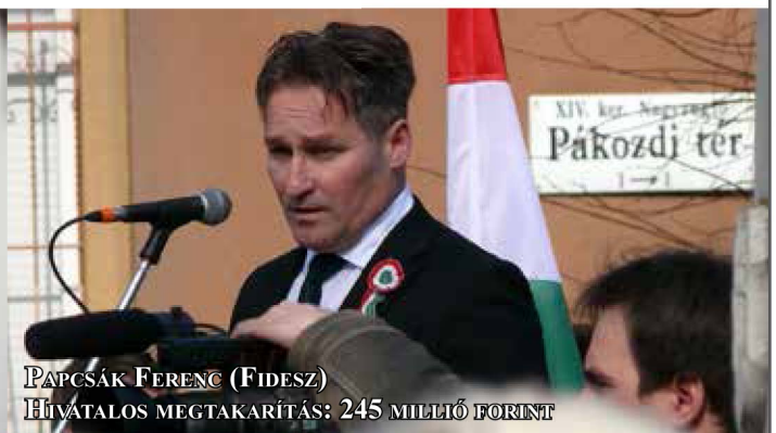
PAPCSÁK FERENC (FIDESZ) HIVATALOS MEGTAKARÍTÁS: 245 MILLIÓ FORINT