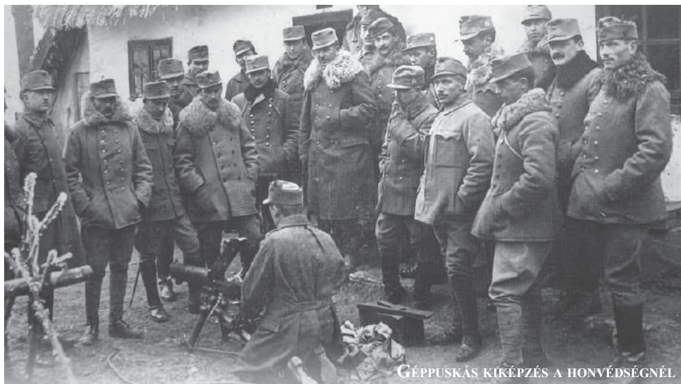
GÉPPUSKÁS KIKÉPZÉS A HONVÉDSÉGNÉL

Az első világháborúért Európa tőkés körei a felelősek. A magyar katonák hősiessen küzdöttek a háborúban. Elhitték, hogy királyuk és parancsnokaik nemes célokért áldozzák fel őket. A magyar uralkodó osztály azonban nem a hazát védte, hanem új területeket akart megszerezni. Nem a békét védelmezte, hanem a háborút használta saját céljainak elérésére. A katonák hősként haltak meg, rossz célokért. Sorozatunkban a háború igazi okait tárjuk fel, a hősökre és áldozatokra emlékezünk, a mai háborúk ellen emeljük fel szavunk.