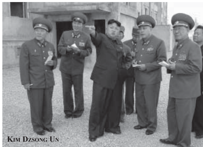
KIM DZSONG UN

Kim Ir Szen halála 1994-ben súlyos veszteség volt a koreai népnek. A Nyugat abban bizakodott, hogy távozásával zavart idéz elő a koreai belpolitikában. A Koreai Munkapárt a Néphadsereg