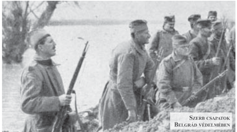
SZERB CSAPATOK BELGRÁD VÉDELMEBEN

Az első világháborúért Európa tőkés körei a felelősek. A magyar katonák hősiességgel küzdöttek a háborúban. Elhitték, hogy királyuk és parancsnokaik nemes célokért áldozzák fel őket. A magyar uralkodó osztály azonban nem a hazát védte, hanem új területeket akart megszerezni. Nem a békét védelmezte, hanem a háborút használta saját céljainak elérésére. A katonák hősként haltak meg, rossz célokért. Sorozatunkban a háború igazi okait tárjuk fel, a hősökre és áldozatokra emlékezünk, a mai háborúk ellen emeljük fel szavunk.