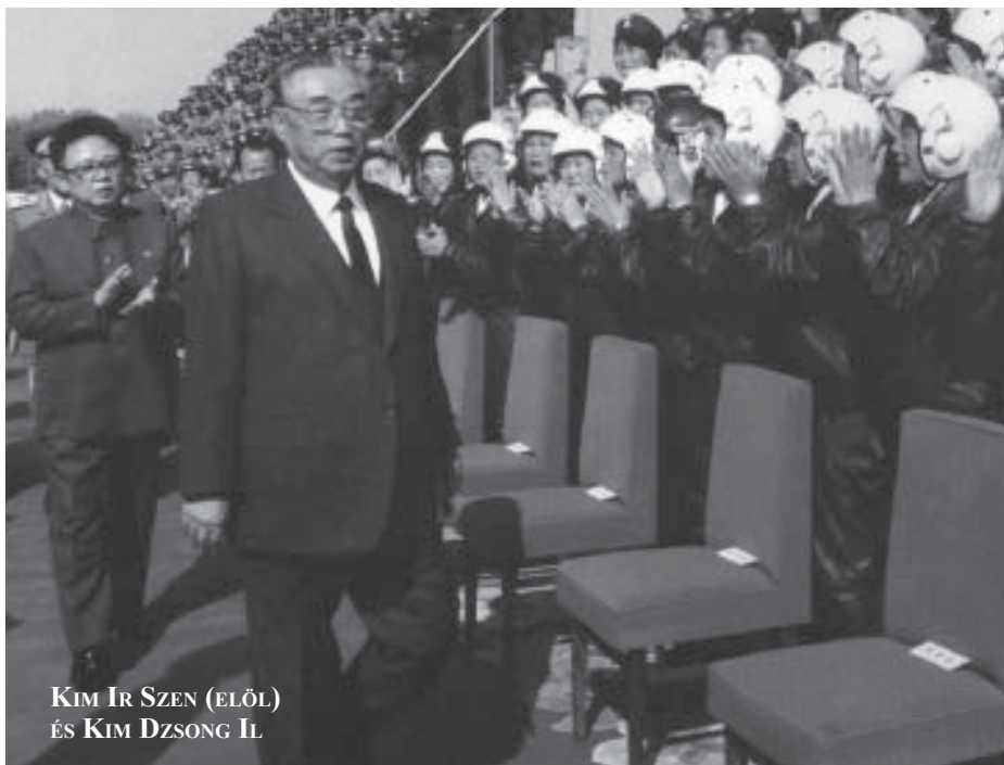
KIM IR SZEN (ELŐL) ÉS KIM DZSONG IL

Alanyi jogon jár minden egyes állampolgárnak az ingyenes egészségügyi ellátás és oktatás is. Az embereknek nem kell adót fizetniük, mivel az állam mindenkié. Az állampolgárok az államért dolgoznak, az állam pedig értük. A koreai nép fizetése egy részét pénzben, másik részét pedig élelmiszerben kapja. Ezzel nincs is gond, mert a fizetés nagyobb részét egyébként is arra költi az ember, a közhiedelemmel ellentétben pedig a pénzben kapott részből lehet a piacon még bevásárolni, ha nem elég. Tehát a készpénz tulajdonképpen szórakozásra és megtakarításokra van.