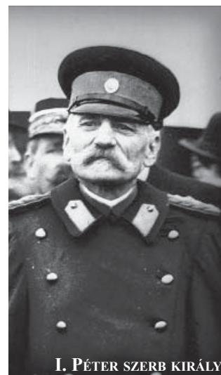
I. PÉTER SZERB KIRÁLY