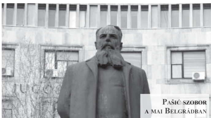
PAŠIĆ SZOBOR A MAI BELGRÁDBAN