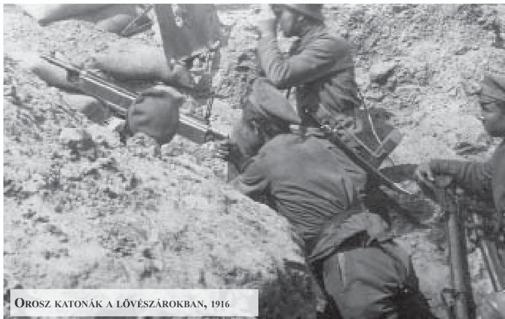
OROSZ KATONÁK A LÖVÉSZÁROKBAN, 1916

Az első világháborúért Európa tőkés körei a felelősek. A magyar katonák hősiessen küzdöttek a háborúban. Elhitték, hogy királyuk és parancsnokaik nemes célokért áldozzák fel őket. A magyar uralkodó osztály azonban nem a hazát védte, hanem új területeket akart megszerezni. Nem a békét védelmezte, hanem a háborút használta saját céljainak elérésére. A katonák hősként haltak meg, rossz célokért. Sorozatunkban a háború igazi okait tárjuk fel, a hősökre és áldozatokra emlékezünk, a mai háborúk ellen emeljük fel szavunk.