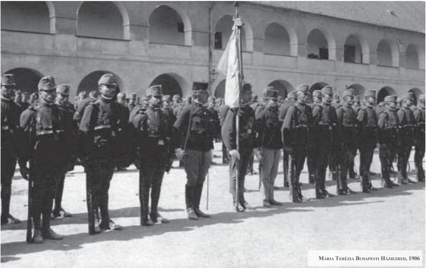
MÁRIA TERÉZIA BUDAPESTI HÁZIEZRED, 1906

Az első világháborúért Európa tőkés körei a felelősek. A magyar katonák hőiesen küzdöttek a háborúban. Elhitték, hogy királyuk és parancsnokaik nemes célokért áldozzák fel őket. A magyar uralkodó osztály azonban nem a hazát védte, hanem új területeket akart megszerezni. Nem a békét védelmezte, hanem a háborút használta saját céljainak elérésére. A katonák hősként haltak meg, rossz célokért. Sorozatunkban a háború igazi okait tárjuk fel, a hősökre és áldozatokra emlékezünk, a mai háborúk ellen emeljük fel szavunk.