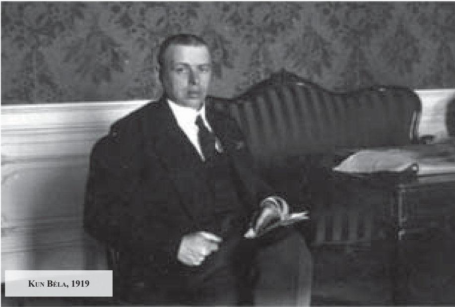
KUN BÉLA, 1919