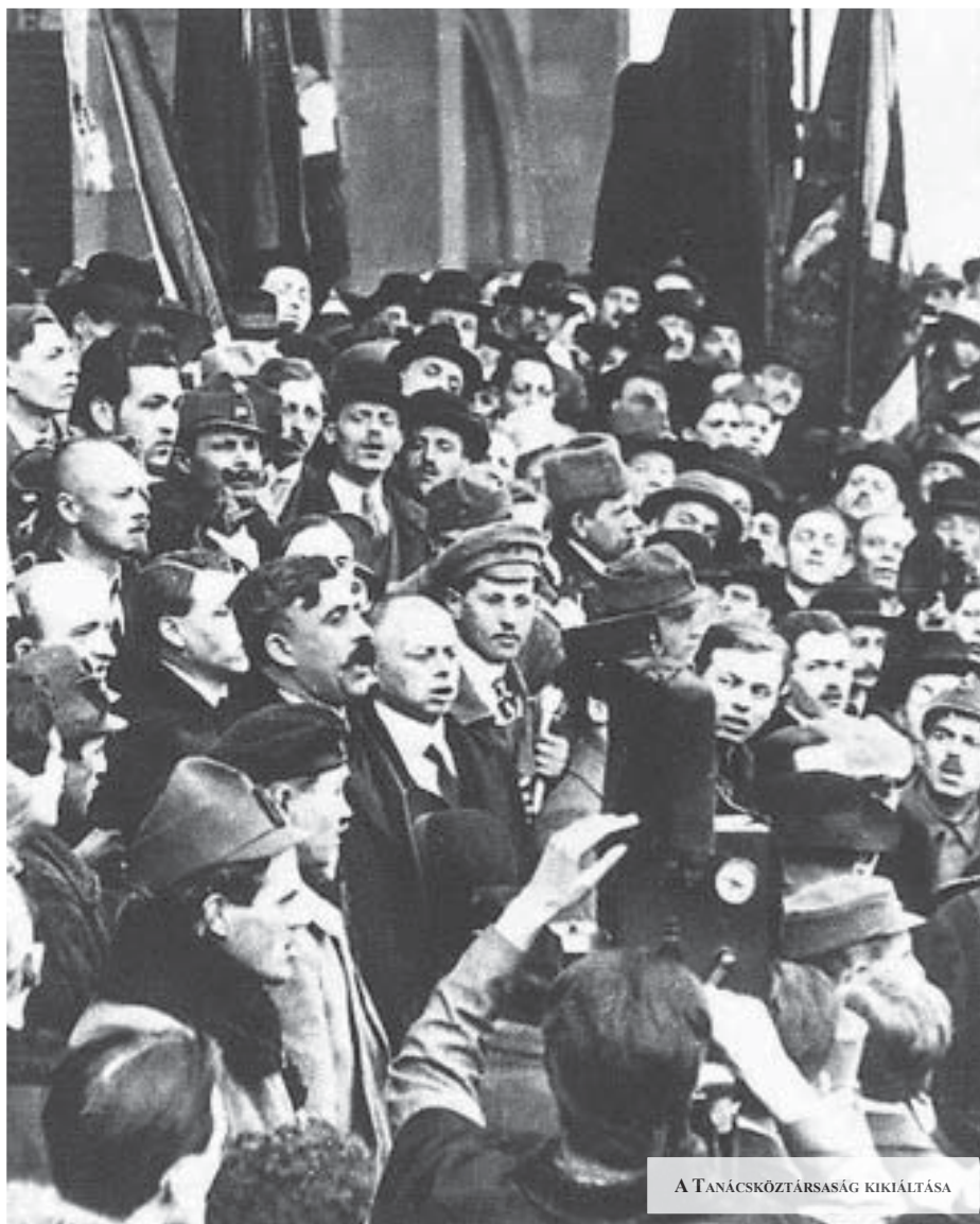
A TANÁCSKÖZTÁRSASÁG KIKIÁLTÁSA

A tanácskormány egységesítette és központosította a hadsereg vezetését. Gödöllőn létrehozták a Hadsereg-főparancsnokságot, mely a szárazföldi és légi erő valamennyi hadműveleti egysége felett kizárólagosan rendelkezett. Az új vezetőszer megalkotásával megszűnt a