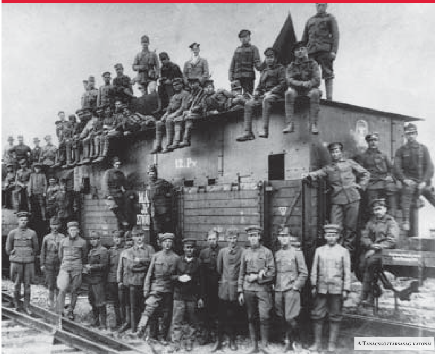
A TANÁCSKÖZTÁRSASÁG KATONÁI

Az első világháborúért Európa tőkés körei a felelősek. A magyar katonák hőiesen küzdöttek a háborúban. Elhitték, hogy királyuk és parancsnokaik nemes célokért áldozzák fel őket. A magyar uralkodó osztály azonban nem a hazát védte, hanem új területeket akart megszerezni. Nem a békét védelmezte, hanem a háborút használta saját céljainak elérésére. A katonák hősként haltak meg, rossz célokért. Sorozatunkban a háború igazi okait tárjuk fel, a hősökre és áldozatokra emlékezünk, a mai háborúk ellen emeljük fel szavunkat.