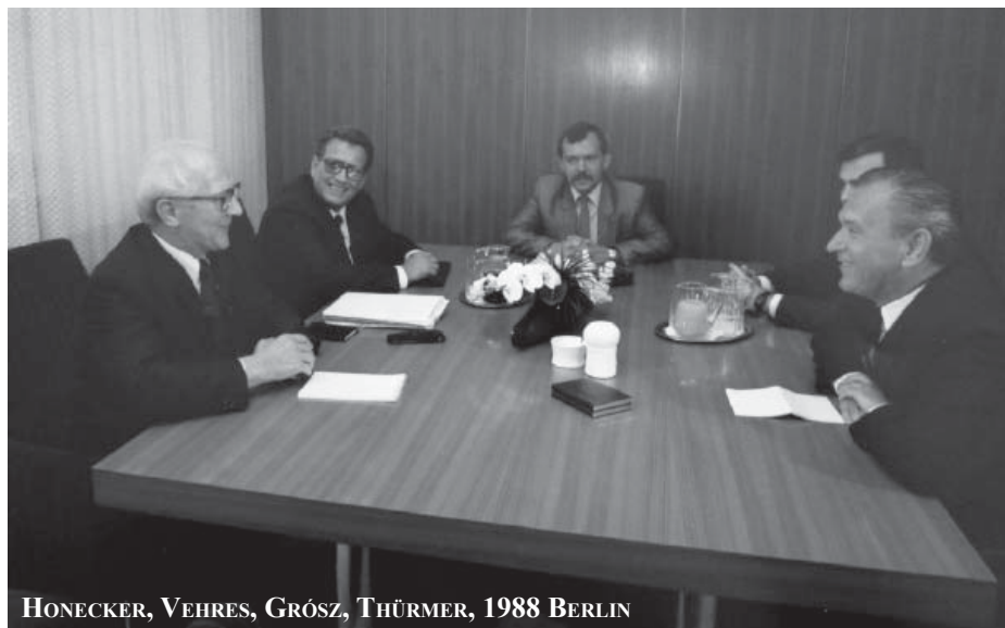
HONECKER, VEHRES, GRÓSZ, THÜRMER, 1988 BERLIN

1989. augusztus 19-én Sopronkőhida és az ausztriai Szentmargitbánya között megrendezett páneurópai pikniken több száz NDK-állampolgár használta fel a határ átmeneti megnyitását arra, hogy Nyugatra szökjön.