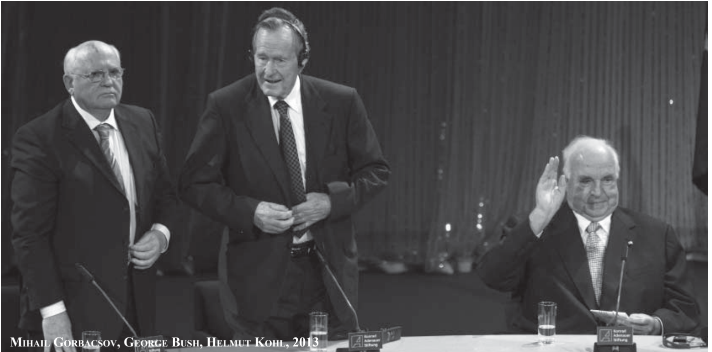
MIHAIL GORBACSOV, GEORGE BUSH, HELMUT KOHL, 2013

1989. augusztus 24-én a Vöröskereszt Nemzetközi Bizottsága egy titkos akció keretében az NSZK budapesti nagykövetségén lévő NDK-s turistákat Ausztriába juttatta. A magyar hatóságok engedélyezték.