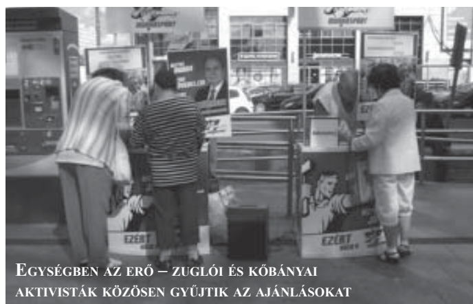
EGYSÉGBEN AZ ERŐ – ZUGLÓI ÉS KÖBÁNYAI AKTIVISTÁK KÖZÖSEN GYŰJTIK AZ AJÁNLÁSOKAT