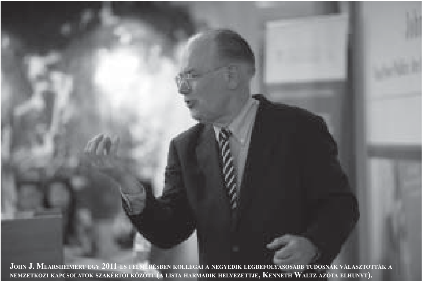
JOHN J. MEARSHEIMERT EGY 2011-ES FELMÉRÉSBEN KOLLÉGÁI A NEGYEDIK LEGBEFOLYÁSOSABB TUDÓSNAK VÁLASZTOTTÁK A NEMZETKÖZI KAPCSOLATOK SZAKÉRTŐI KÖZÖTT (A LISTA HARMADIK HELYEZETTJE, KENNETH WALTZ AZÓTA ELHUNYT).

JOHN J. MEARSHEIMER AMERIKAI PROFESSZOR SZERINT WASHINGTON 5 MILLIÁRD DOLLÁRRAL TÁMOGATTA A KIJEVI „DEMOKRATÁKAT”