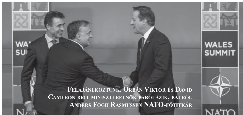
FELAJÁNLKOZTUNK. ORBÁN VIKTOR ÉS DAVID CAMERON BRIT MINISZTERELNÖK PAROLÁZIK, BALRÓL ANDERS FOGH RASMUSSEN NATO-FŐTTIKÁR

A NATO 28 tagállamának állam- és kormányfői nyilatkozatban deklarálták, hogy a védelmi kiadások aránya 2024-ig megközelíti a GDP 2 százalékát. Ezen belül a védelmi költségvetés legalább 20 százalékát a haderő fejlesztésére kell