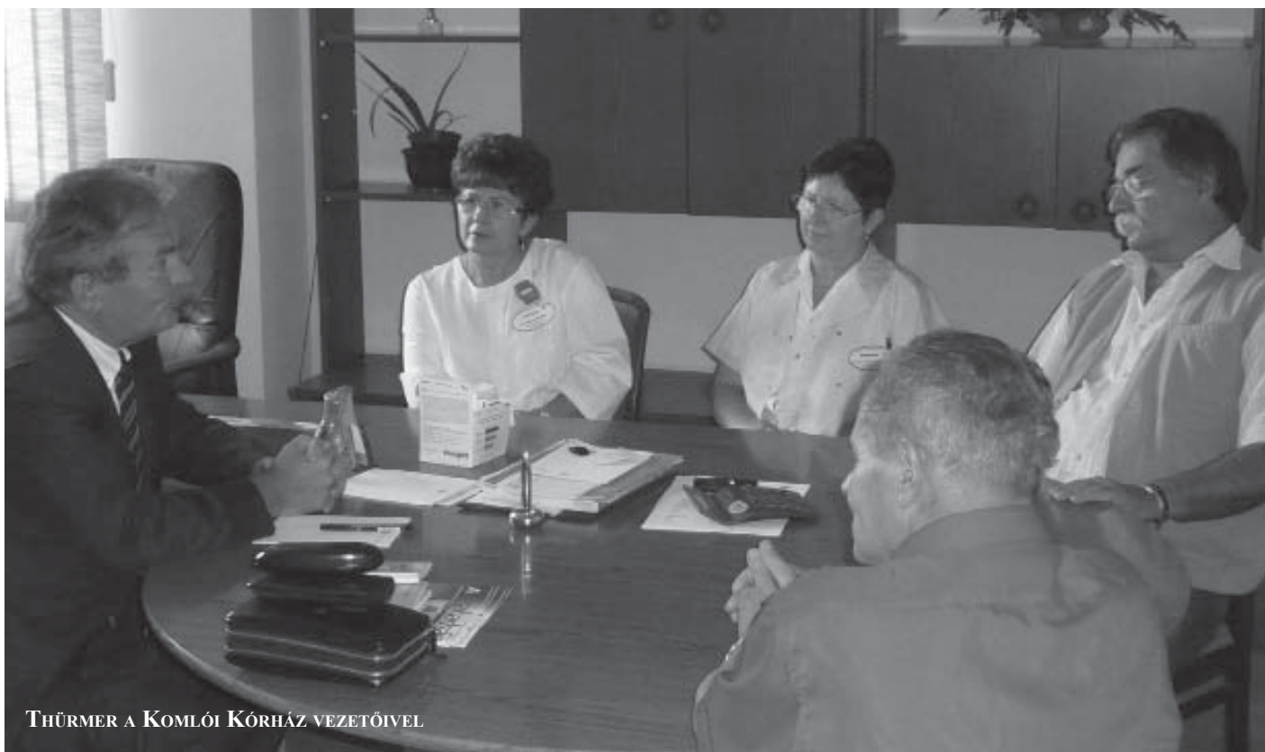
THÜRMER A KOMLÓI KÓRHÁZ VEZETŐIVEL

Az ügyesség vádat emel az Elnökség minden akkori tagja ellen. Nem az Elnökséget, mint intézményt perelik, hanem az egyes tagokat köztörvényes alapon. A bíróság beír bennünket a történelembe. Magyar bíróság előtt emberemlékezet óta nem állt egy teljes párt teljes vezetése. 2007 szeptemberében Székesfehérváron, első fokon elítélik az Elnökség tagjait. Az érintettek bűnösök: „nagy nyilvánosság előtt elkövetett rágalmozás vétségében, mint társtettes. Ezért őt a bíróság 2 (kettő) évre próbára bocsátja” – mondja ki a Székesfehérvári Városi Bíróság. Másodfokon azonban felmentenek bennünket, és ezt hagyja helyben a Fővárosi Ítéletábla is 2008 végén. ■