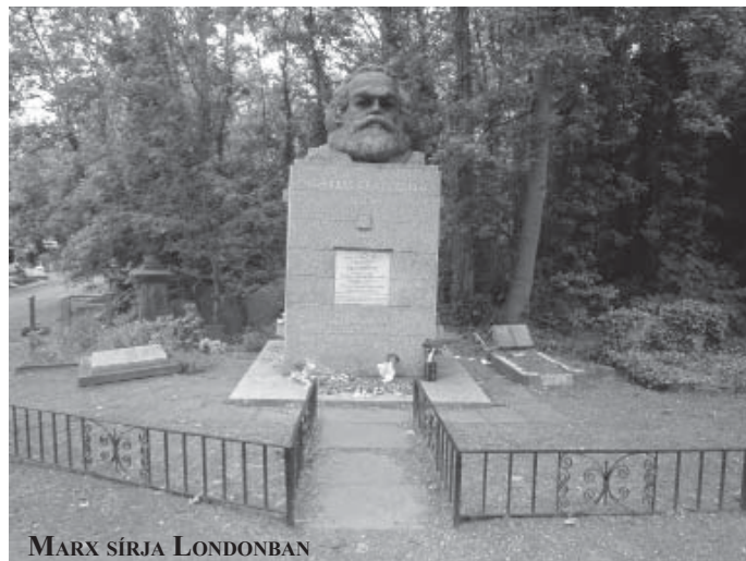
MARX SÍRJA LONDONBAN

Az új közösségi társadalom fejlődése viszont úgy megy végbe, hogy minden egyes ember érzi ennek jó hatásait. Miért lehetséges ez? Azért, mert a termelő eszközök, a gyárak, a bankok és a politikai hatalom nem egy szűk csoport, hanem a dolgozók, azaz a többség kezében van. ■