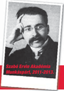
Szabó Ervin Akadémia Munkáspárt, 2011-2013.