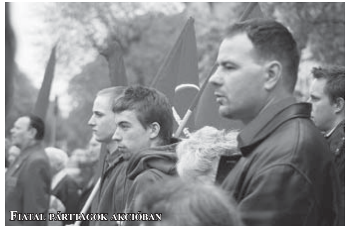
FIATAL PÁRTTAGOK AKCIÓBAN

A Munkáspárt a demokratikus centralizmus elve alapján működik. Ez egy működési elv. Ez sok mindent jelent. Elsősorban azt, hogy a döntéseket minden szinten demokratikusan kell előkészíteni, alaposan meg kell vitatni. A párt azonban nem vitaklub, nem állhat meg a vitánál, döntenie is kell.