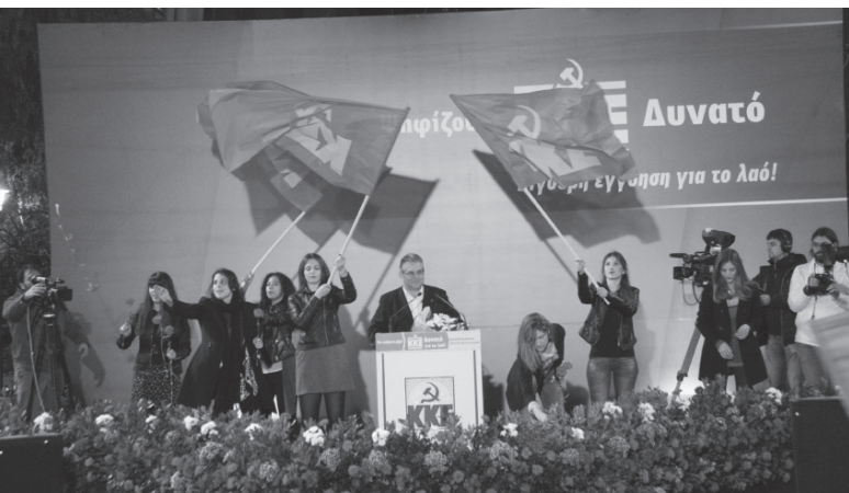
KKE-GYŰLÉS 2015 JANUÁRJÁBAN ATHÉN FŐTERÉN