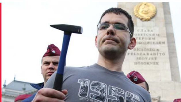
A JOBBIKOS NOVÁK ELŐD SZÉTVERNÉ A SZOVJET EMLÉKMŰVET, HA TUDNÁ

MUNKÁSPÁRT: A Jobbik arcátlanul igyekszik becsapni azokat, akiknek a tőkés rendszerváltás szenvedést, rosszabb életet, bizonytalanságot okozott. Az emberek azért emlékeznek a szocializmusra, mert akkor a dolgozó embernek jobb volt. A Jobbik nem akar szocializmust, nem akarja jobbá tenni az emberek életét.