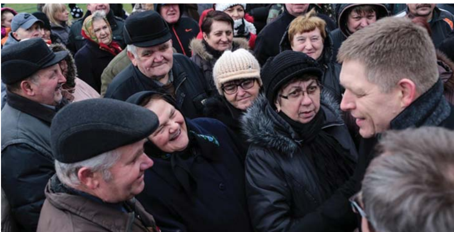
ROBERT FICO LÁTOGATÁSA KUBÁBAN

Az európai kapitalizmus 2008-ban kezdődő válsága érintette az 5,4 millió lakosú Szlovákiát is. A válság előtt a szlovák