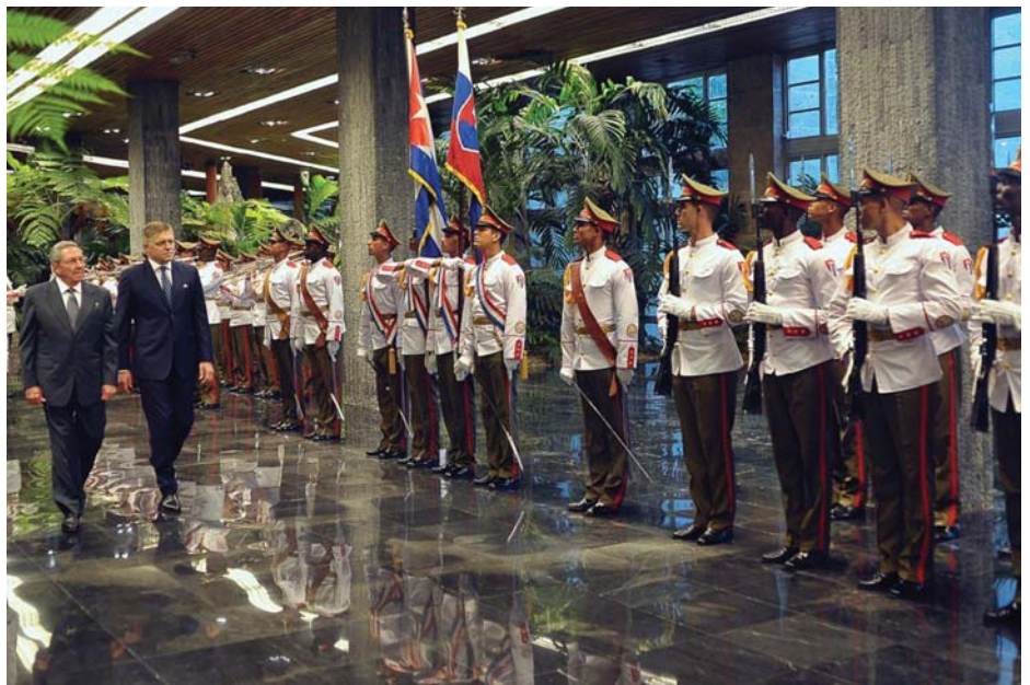
ROBERT FICO KAMPÁNYOL

gazdaság évi növekedése meghaladta a 6 százalékot. 2011-ig Szlovákia volt az EU leggyorsabban fejlődő országa. A válság azonban visszavetette a fejlődést. A szlovák tőkésosztály számára is a megszorítások jelentették a megoldás eszközeit.