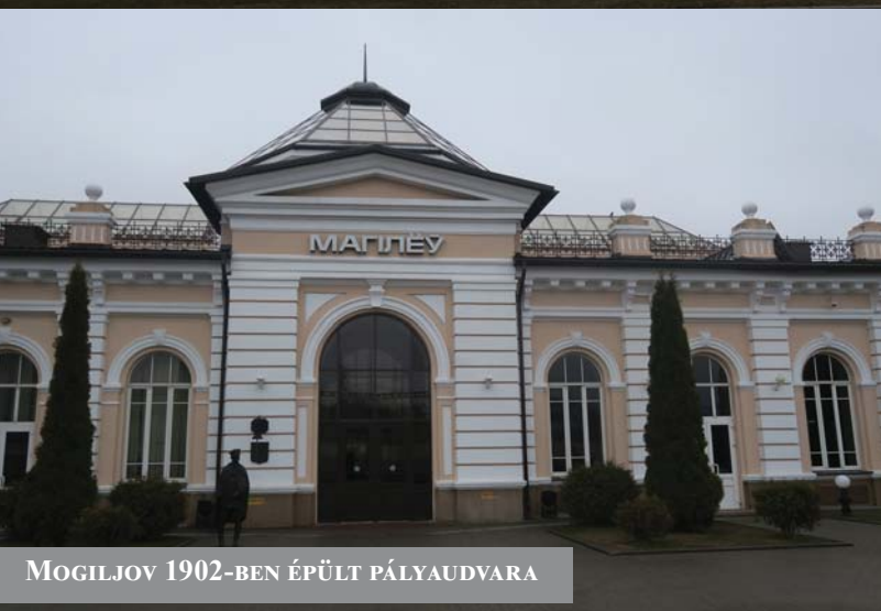
MOGILJOV 1902-BEN ÉPÜLT PÁLYAUDVARA