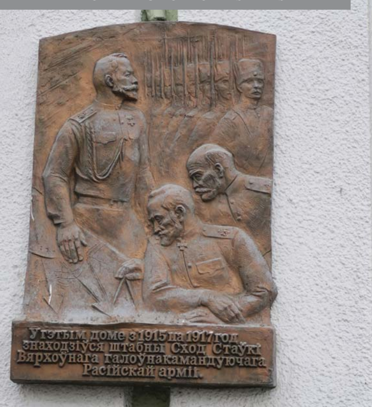
EMLÉKTÁBLA ŐRZI AZ EGYKORI FŐHADISZÁLLÁS EMLÉKÉT

2017-ben lesz 100 esztendeje annak, hogy 1917 februárjában II. Miklós, az utolsó orosz cár lemondott a trónról, és ezzel a polgári demokratikus forradalom elérte célját, megszűnt a cári monarchia. Az évfordulóra készülnek Belaruszban is. A ma 365 ezer lakosú kelet-belarusz város, Mogiljov története is számtalan szállal kötődik a száz esztendővel ezelőtti eseményekhez.