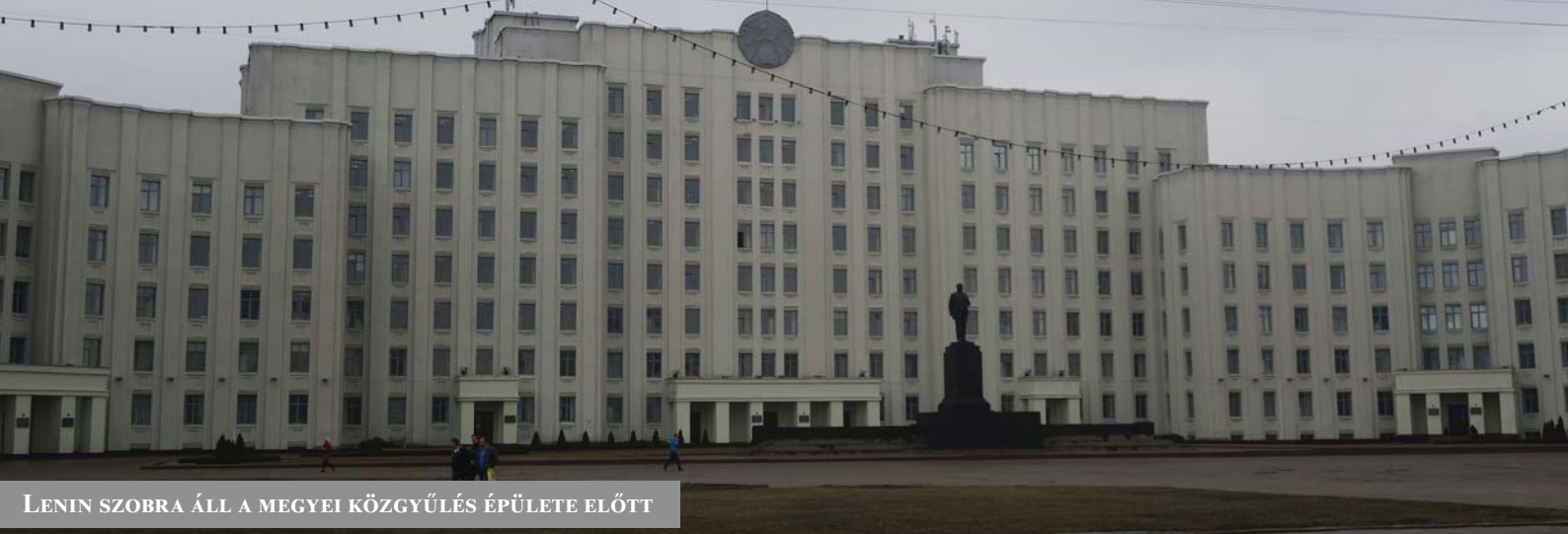
LENIN SZOBRA ÁLL A MEGYEI KÖZGYŰLÉS ÉPÜLETE ELŐTT