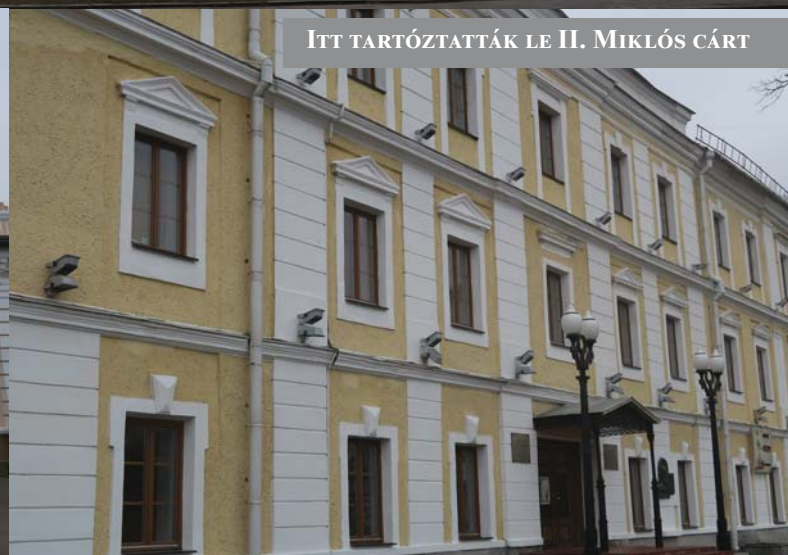
ITT TARTÓZTATTÁK LE II. MIKLÓS CÁRT