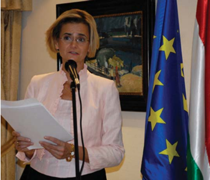
GYÖRI ENIKŐ MADRIDI NAGYKÖVET BESZÉDET MOND OKTÓBER 23-ÁN

A madridi önkormányzat közgyűlése Györi Enikő madridi magyar nagykövét kezdeményezésére egyhangúan döntött arról, hogy a spanyol fővárosban szobrot állítanak „az 1956-os magyar forradalom és szabadságharc” emlékére.