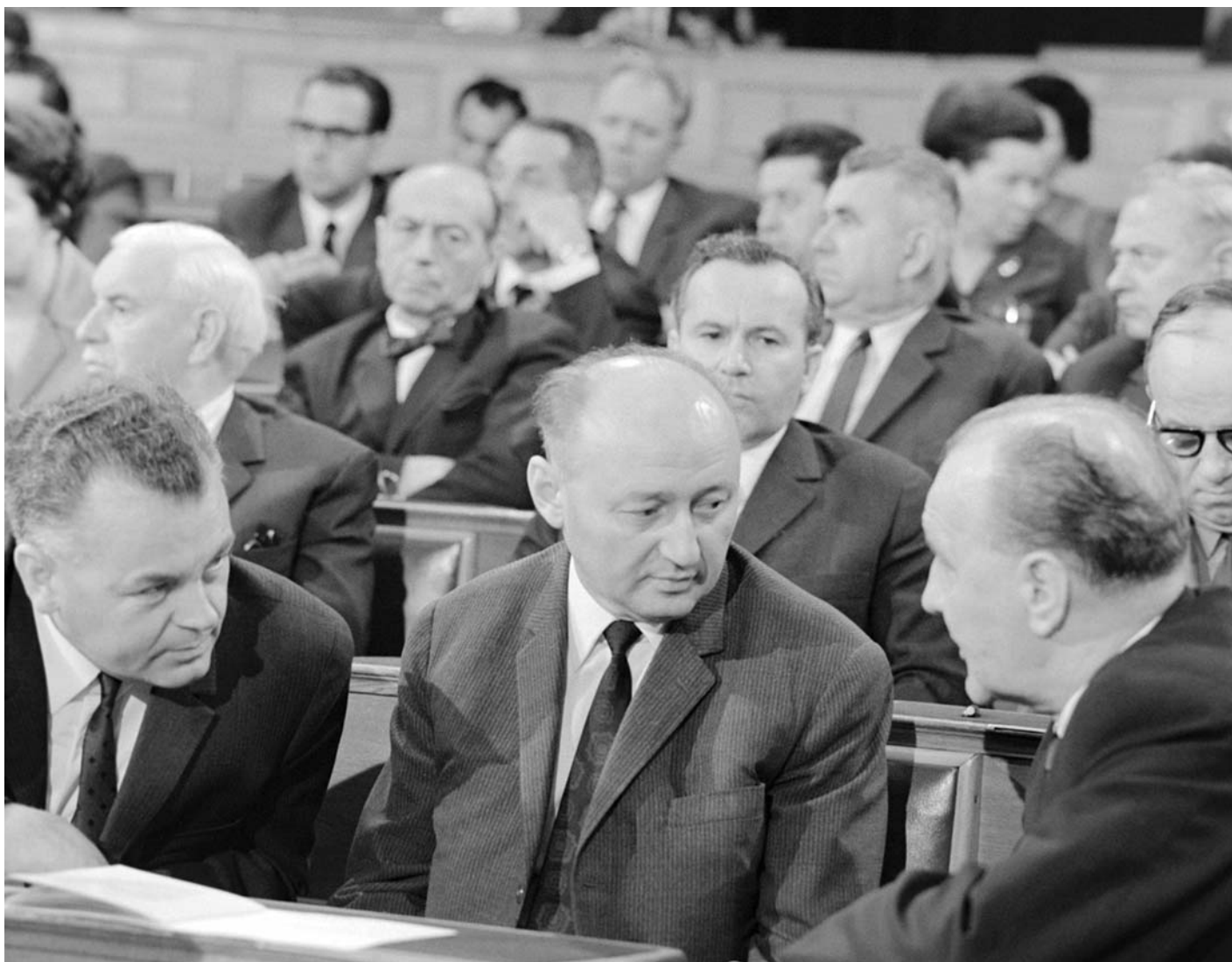
BISZKU BÉLA (KÖZÉPEN) NÉMETH KÁROLYVAL ÉS KÁDÁR JÁNOSSEL

Kádár János 1989-ben hunyt el. A szocialista kor más vezetői is eltávoztak idővel. A tőkés hatalom Biszku Bélát szemelte ki, hogy precedens értékű perben leplezze le a szocializmus korszakát. A tőkés hatalom oly mértékben demonizálta Biszku személyét, hogy nem számíthatott közéleti személyiségek, netán mozgalmak támogatására. Az idős ember a maga igazságát védte. És győzött. A halál immáron örökre legyőzhetlenné tette. ■