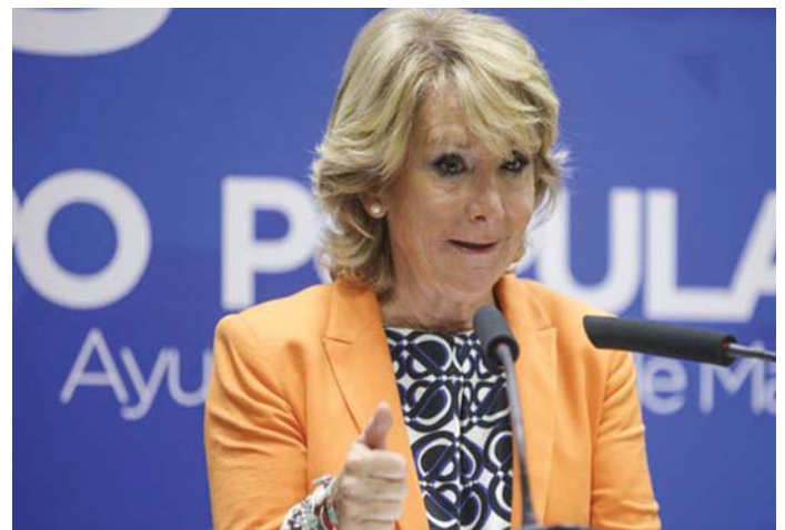
ESPERANZA AGUIRRE GRÓFNŐ

A másik, és ez talán súlyosabb: miért kell neveltségessé tenni Magyarországot? Nem tudjuk, tudják-e? 2016 Bartók Emlékév, mivel 135 éve született. Apropos, Madridban nincs Bartók-szobor. De kinek kell egy Bartók-szobor? ■