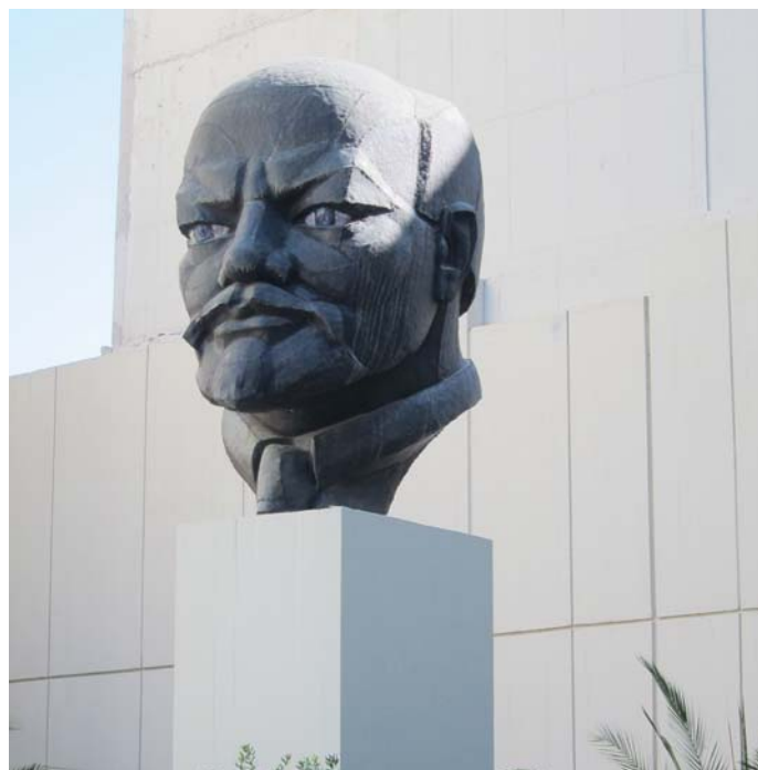
LENIN-SZOBOR A GÖRÖG KOMMUNISTA PÁRT SZÉKHÁZÁBAN

A 20. század második felében a tömegpártok gyűjtőpárttá alakulnak. Alapvetően ezek is a tőkésosztály valamely csoportjának érdekeit fejezik ki, de egyidejűleg sok társadalmi réteget igyekeznek magukba foglalni. A gyűjtőpárt logikája a fogyasztói logikára hasonlít. A párt az állam és a társadalom között közvetítő alkuszhoz hasonlít, és próbálja eladni