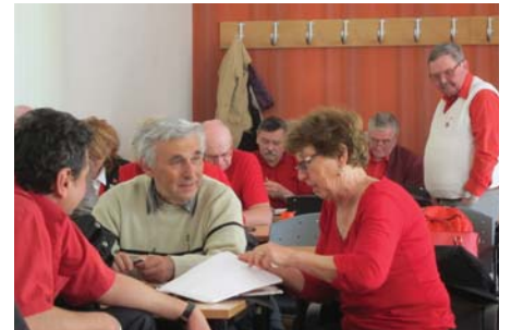
AKTÍV VÉLEMÉNYCSERE A KB ÜLÉSÉN

Szólt arról, hogy a 26. kongresszus új feladatokat állított a pártépítés elé. Ha mind a 106 országgyűlési választókerületben