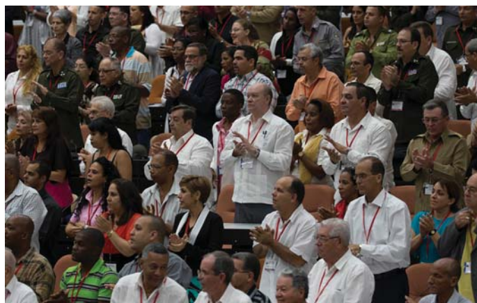
A KONGRESSZUS KÜLDÖTTEI AZ ÚJ VEZETÉST KÖSZÖNTIK

történelmi részvevőinek csak egy korlátozott csoportja marad a vezetés tagja, tekintettel előrehaladott életkorukra. A következő öt évben fokozatosan és rendezett formában kell átadni a vezetői funkciókat a fiatalabb nemzedékeknek, és a folyamatot a Kubai KP 8. Kongresszusán kell lezárni 2021-ben. A jövőre nézve