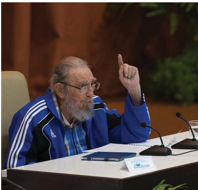
FIDEL CASTRO IS MEGJELENT A KONGRESSZUS UTOLSÓ SZAKASZÁBAN

A kongresszus úgy döntött, hogy a Központi Bizottságnak évente legalább kétszer üléseznie kell. A kongresszus elvi állást foglalt személyi kérdésekben is. E szerint az 1959-es forradalom