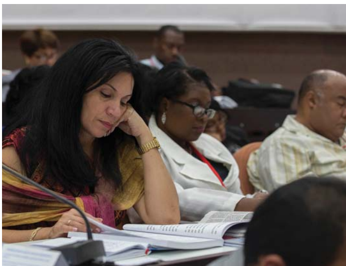
A KÜLDÖTTEK A DOKUMENTUMOKAT TANULMÁNYOZZÁK

Havannában befejeződött a Kubai Kommunista Párt 7. Kongresszusa. A négy napos fórum döntött a kubai gazdasági és társadalmi fejlődés új modelljéről. A változtatásokat fokozatosan, a nép egyetértésének mértékében kívánják valóra váltani. A cél a virágzó, fenntartható és visszafordíthatatlan szocialista társadalom felé való haladás. A kongresszus kizárt mindenfajta visszatérést a kapitalizmushoz, elvetette a sokterápiák alkalmazását. Megerősítette, hogy Kubában senki sem maradhat segítség nélkül, ha bajba kerül.