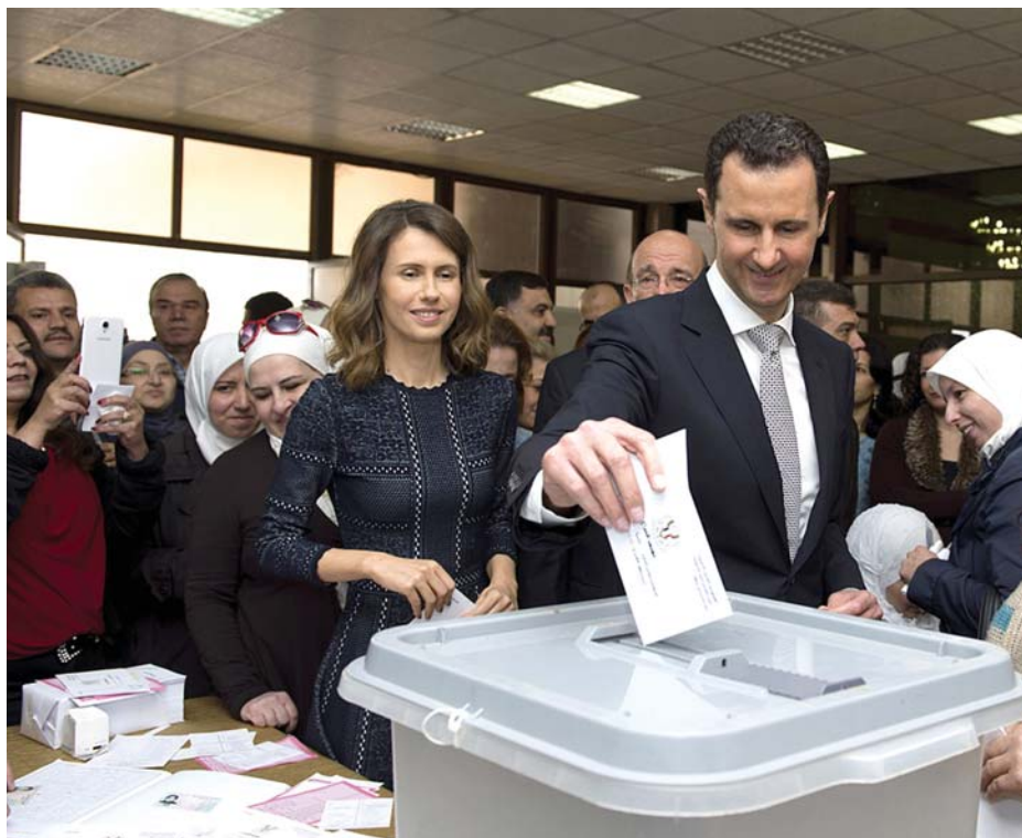
ASZAD ELNÖK SZAVAZ AZ ÁPRILISI PARLAMENTI VÁLASZTÁSOKON