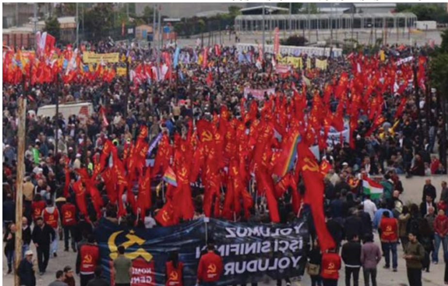
MÁJUS ELSEJEI FELVONULÁS ISZTAMBULBAN

A dolgozói tudatot meg kell tanulnunk és meg kell tanítanunk másoknak. Marx, Engels, Lenin műveit sok párhelyiségünkben meg lehet találni. Olvassuk őket! Minden lépésünk előtt gondoljuk végig, hogy ők miként elemeztek hasonló helyzeteket, mit tettek, hogyan cselekedtek!