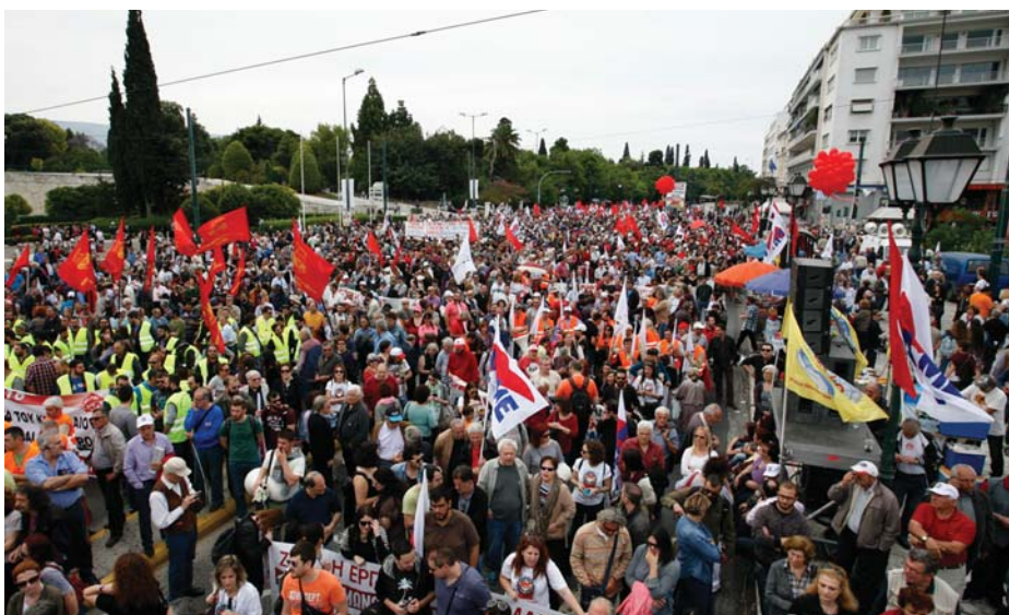
GÖRÖG KOMMUNISTA TŰNTETÉS A SYNTAGMA TÉREN

sok millió szegény van, de „nemzeti kormány vagyunk”, és az gondoskodik arról, hogy a „nemzet minden tagja minden évben egy kicsivel előbbre jusson.” Vagyis harc nem kell, a különbség a gazdag és szegény között elmosódik. Hajrá magyarok, hajrá Magyarország!