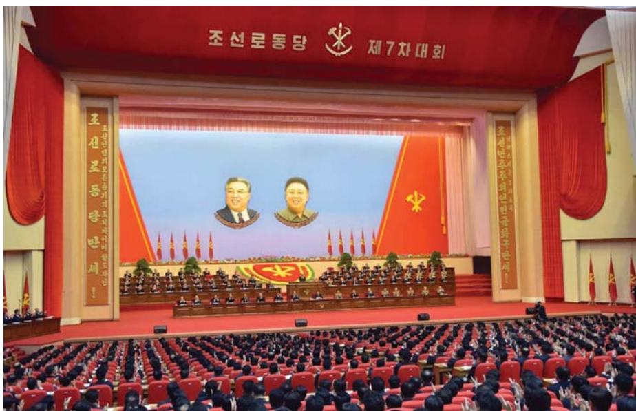
A KMP 7. KONGRESSZUSÁNAK MEGNYITÁSA

parasztnak mintegy 24 százalékot tettek ki. A küldöttek 9 százaléka volt nő.