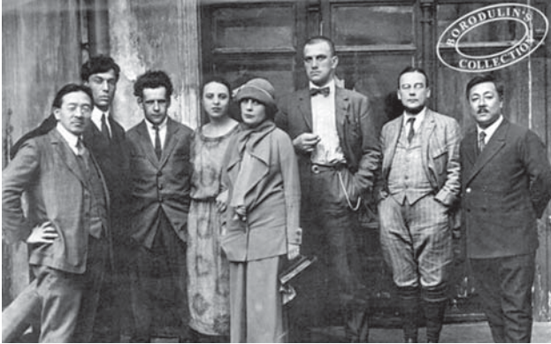
MAJAKOVSZKIJ BARÁTAIVAL, AZ ÍRÓ KÖZÉPEN, EISENSTEIN BALRÓL A MÁSODIK, MELLETTE PASZTERNÁK