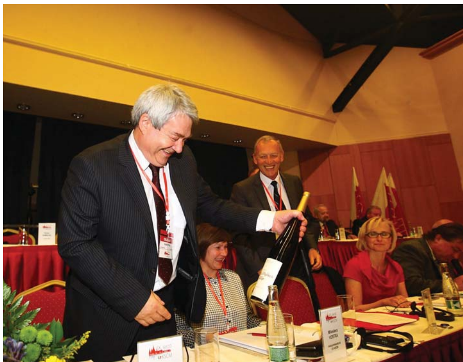
AJÁNDÉK AZ ÚJRAVÁLASZTOTT ELNÖKNEK

a Görög KP, a német Baloldali Párt, az Ukrán KP, a Francia KP, a Szlovák KP, az Oroszországi Föderáció Kommunista Pártja, a Portugál KP küldöttsége.