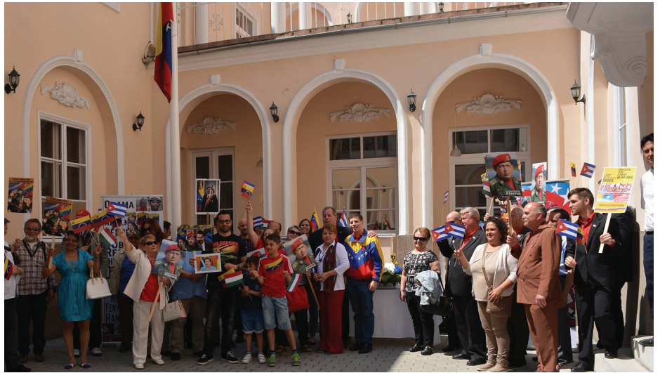
A GYŰLÉS RÉSZTVEVŐI A NAGYKÖVETSGÉ UDVARÁN