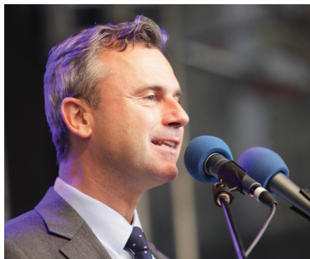
NORBERT HOFER, AZ ALULMARADT JELÖLT

Az Osztrák Munkapárt (PDA) álláspontja szerint az elnökválasztás nem más, mint az osztrák tőkés rendszeren belüli politikai játszma. Bárki is legyen az elnök, az osztrák dolgozónak nem lesz jobb, ezért „egyik sem érdemeli meg szavazatunkat.” A PDA szerint Alexander Van der Bellen az „politikusi típus, aki számára teljesen idegen a dolgozó ember valóságos élete” Az új elnök „előkészíti az utat ahhoz, hogy Ausztria feladja demokratikus jogait és szuverenitását, alávesse Ausztria érdekeit a német befolyás alatt álló EU-imperializmusnak.”