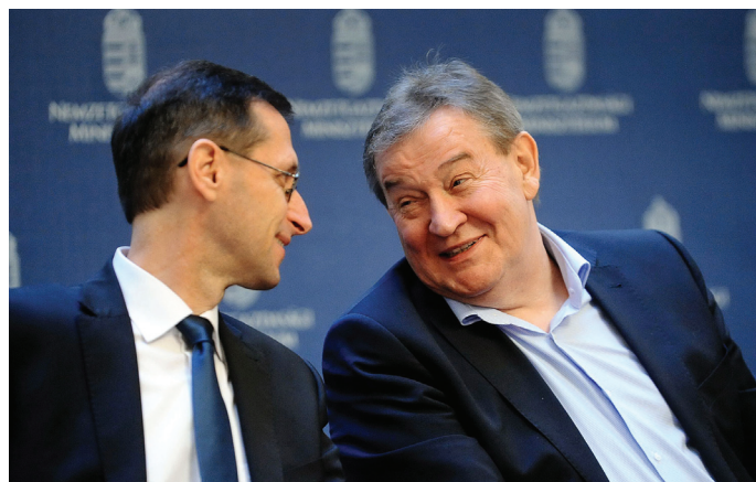
VARGA MIHÁLY NEMZETGAZDASÁGI MINISZTER ÉS GASKÓ ISTVÁN, A LIGA SZAKSZERVEZETEK KORÁBBI VEZETŐJE

A KSH meghatározása szerint a sztrájk „a dolgozók egy vagy több csoportja által kezdeményezett időleges munkabeszüntetés annak érdekében, hogy kikényszerítsék valamilyen követelésük teljesítését, illetve ellenállásukat fejezzék ki valamivel szemben, így nyilvánítsák ki sérelmüket, esetleg más dolgozókat