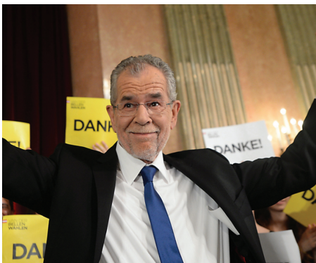
ALEXANDER VAN DER BELLEN ÚJ OSZTRÁK ELNÖK

Ausztria megijedt önmagától. A vasárnapi választások végeredményére hétfő estig kellett várni. Túlzás nélkül mondható, hogy egész Ausztria, és talán egész Európa lélegzetvisszafojtva várta az eredményt. Sobotka osztrák belügyminiszter hétfőn este közölte: 31026 szavazattal a 72 éves Alexander Van der Bellen lett az új köztársasági elnök. A választók 72,75 százaléka szavazott. Mintegy 746 ezer érvényes szavazat levélben érkezett, amire az osztrák törvények lehetőséget adnak. Az osztrákok jelentős része a Szabadságpárt jelöltje, a 45 éves Norbert Hofer mellett volt, aki ellenzi a menekültek betelepítését, normális viszonyt akar Oroszországgal, elsődlegesnek tartja az osztrák nemzeti érdekeket. Ellene valóságos ellentábor jött létre, ahol a zöldektől kezdve a liberálisokon át a baloldal sokféle árnyalatáig mindenki megtalálható. Az ellenjelölt a zöld-liberális hátterű Alexander Van der Bellen volt. Az osztrákok zöme érti, hogy Hofer nem fasiszta, nem antiszemita, amivel ellenfelei riogatják az embereket. De Hofer megválasztása átszabná az osztrák politikát, felrúgná a hagyományos tőkés pártok uralmát, és változást indíthatna el Európában. Ausztria megijedt a felelősségtől.