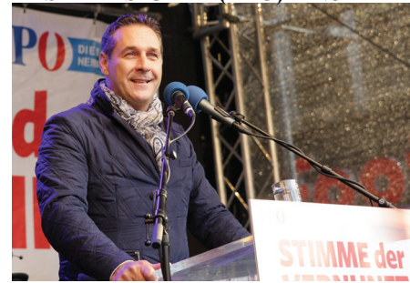
HEINZ-CHRISTIAN STRACHE, AZ SZABADSÁGPÁRT (FPÖ) ELNÖKE

A Magyar Munkáspárt központi politikai lapja. Szerkeszti a szerkesztőbizottság.