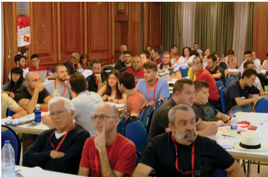
ÜLÉSEZIK A KONGRESSZUS