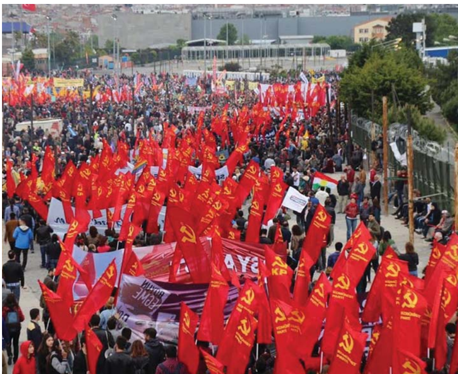
TÖRKORSZÁG: A TŐKE ELLEN MINDENHOL HARCOLNAK

szűnt meg. Magyarországon van autógyártás, műszergyártás, építőipar és sok minden más.