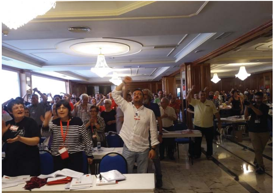
A KÜLDÖTTEK A KÜLFÖLDI VENDÉGEKET ÜDVÖZLIK

A PCPE az európai kommunista mozgalom egyik legkövetkezetesebb, legelkötelezettebb tagja. Aktív részese a Kommunista és Munkáspártok évenkénti találkozójának. Az európai kommunista pártok Kezdeményezés elnevezésű együttműködésének alapítói között voltak. Részt vesznek a közös folyóirat, a Kommunista Szemle szerkesztésében is.