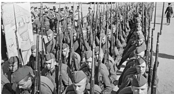
A FRONTRA INDULÓ SZOVJET KATONÁK JÚNIUS 22-ÉN

irányította az országot, a fegyveres küzdelmet és nemzetközi ügyeinket.