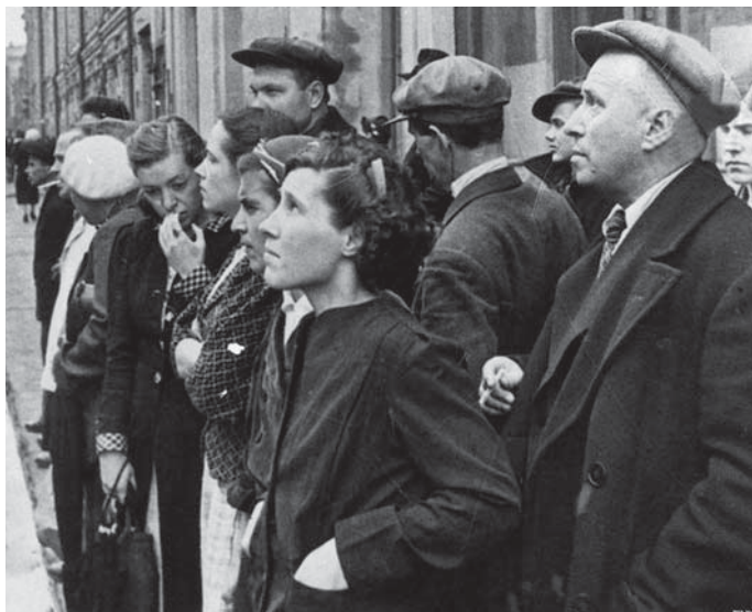
SZOVJET EMBEREK A HÁBORÚ BEJELENTÉSÉT HALLGATJÁK

Véletlenül fennmaradt az a feljegyzésem, amelyet 1941. július 22-én, vagyis pontosan egy hónappal a szovjet—német háború kirobbanása után írtam. Egy hónapja tart a háború a szovjet—német fronton... Szörnyű hónap! A Vörös Hadsereg egyre visszavonul,