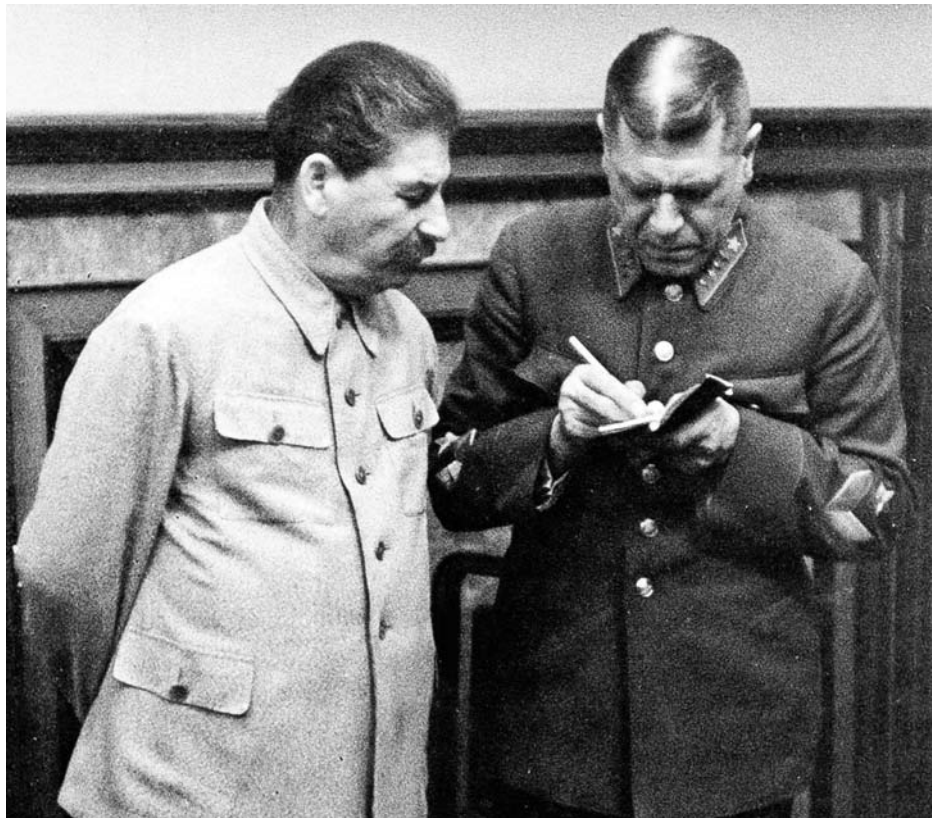
SZTÁLIN SAPOSNYIKOV MARSALLAL, A VEZÉRKAR FŐNÖKÉVEL 1941-BEN

Egykori szemtanúkat idézünk. Georgij Konsztantyinovics Zsukov, a második világháború legkiemelkedőbb szovjet hadvezére, Sztálin helyettese volt. Ivan Mihajlovics Majszkij szovjet diplomata volt, abban az időben a Szovjetunió londoni nagykövete.