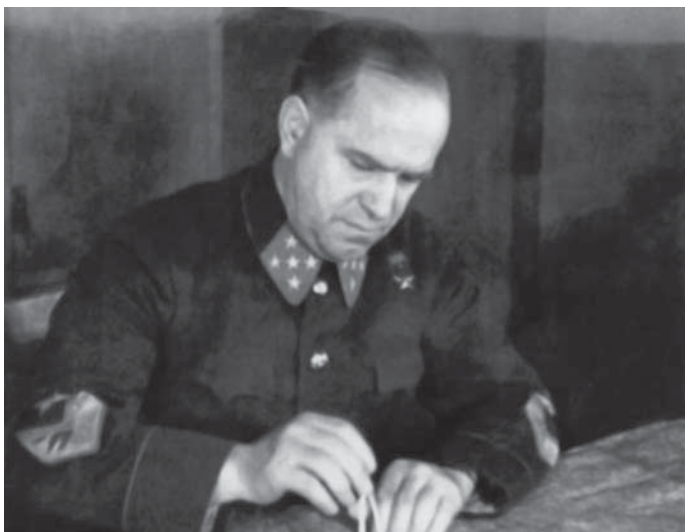
ZSUKOV A MOSZKVAI CSATA IDEJÉN

A szovjet emberek hazájukat védték. De védték azt a társadalmi rendszert, amely 1917 után jobb életet, felemelkedést hozott sok millió embernek az egykori orosz birodalom területén. A szovjet katonák támadásba indulva így kiáltottak: „A hazáért! Sztálinért!”