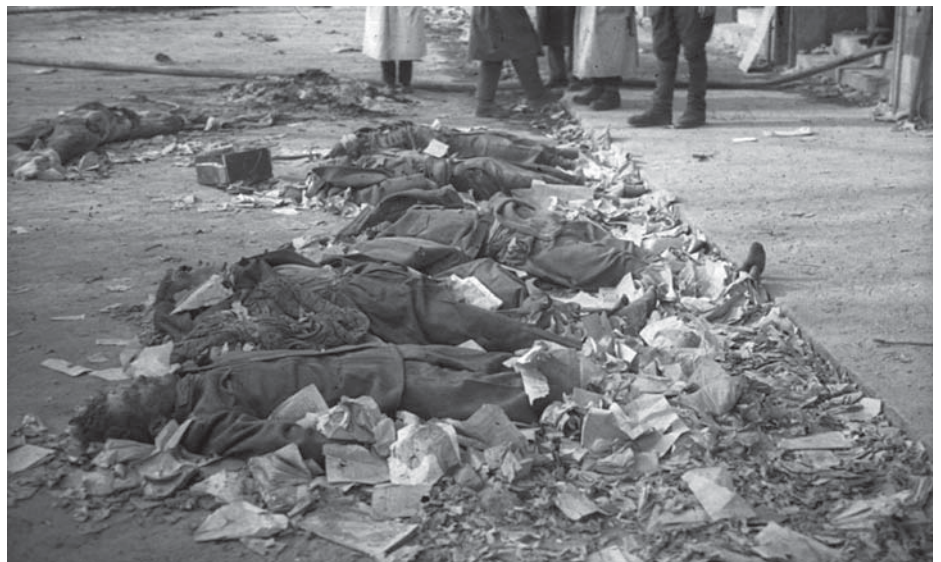
1956. OKTÓBER 30-A: A KÖZTÁRSASÁG TÉR PÁRTHÁZ KIVÉGZETT VÉDŐI

Felgyorsult a küzdelem. Marad-e Magyarország a német fasizmus alóli felszabadulás után választott úton, szocialista ország marad-e vagy megdöntik a szocializmust, mint ahogyan 1919 augusztusában történt? ■