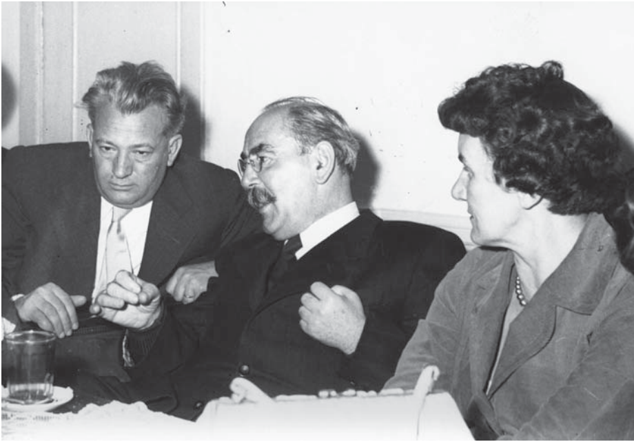
NAGY IMRE DARVAS JÓZSEF NÉPMŰVELÉSI MINISZTERREL ÉS RAJK LÁSZLÓNÉVAL 1956 OKTÓBERÉBEN

1961-ben felfüggesztették, majd teljes amnesztiát kapott. A szocialista Magyarország elismert írójaként huny el 1977-ben.