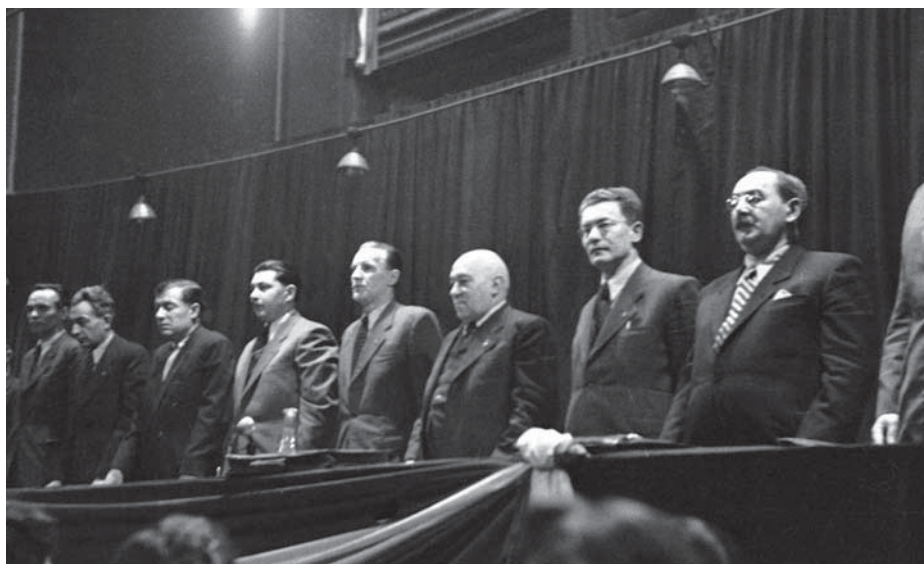
AZ MDP VEZETÉSE 1949-BEN

A kapitalizmus is és a szocializmus is hosszú történelmi folyamatban jön létre, formálódik és fejlődik. A fejlődés egyrészt annak következménye, hogy az uralkodó osztály