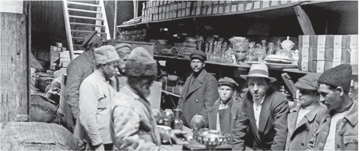
MEGINDUL A PIAC A NEP IDEJÉN

lehetővé tette az ellenforradalom számára, hogy kibontakozzék, s nemcsak a párt, de a haza árulójává is vált.” – mondta Kádár János Gorbacsovnak 1985-ben.