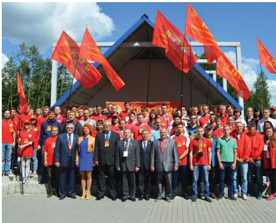
KOMMUNISTA FIATALOK GYŰLÉSE A VÁLASZTÁSOK ELŐTT

Az emberek életkörülményei nem azonosak. A statisztika szerint a legjobb helyzetben a 40-60 év közötti, nagyvárosban élő, saját lakással rendelkező emberek vannak. A belarusz modell nagyfokú szabadságot biztosít az embereknek. Az egyetemekről kikerülő fiatalot keresik a nagy gazdasági cégek. Sokan vállalnak munkát Oroszországban vagy az EU országaiban.