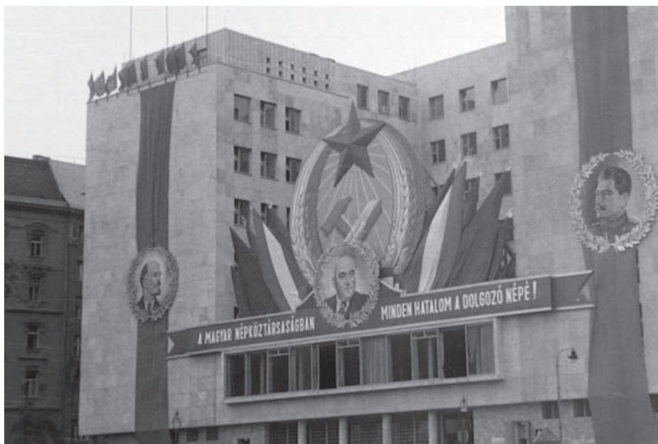
A BELÜGYMINISZTERIUM SZÉKHÁZA 1950-BEN, MA KÉPVISELŐI IRODAHÁZ

Kornai János akadémikus nem is titkolja művében, hogy mi a reformot követelők igazi célja: „Rövid távon üdvös a reform minden olyan mozzanata, amely a kortárs nemzedékek életét akár csak egy kissé megkönnyíti: legalább valamelyest emeli sok ember életszínvonalát, növeli sok ember szabadságát és autonómiáját, ritkábbá teszi a megaláztatást, enyhíti a félelmet. Hosszú távon pedig a reform eróziót indít el a halhatatlan