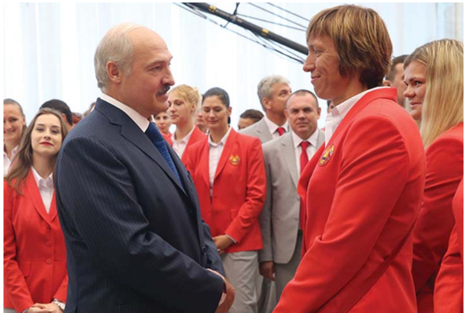
LUKASENKO ELNÖK BELARUSZ OLIMPIKONOKKAL

Szavazhat minden 18. életévét betöltött állampolgár.