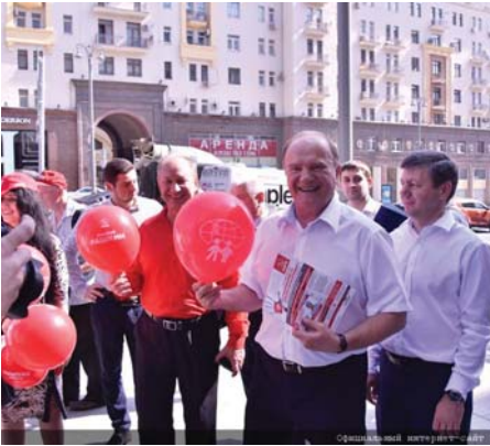
GENNAGYIJ ZJUGANOV, A KPRF ELNÖKE MOSZKVÁBAN

a párt választási programja. Magyarán: kész az országot kormányozni. A Gennagyij Zjuganov vezette orosz kommunisták helyzete sajátos. Oroszországban nincs erős szociáldemokrata párt, amely elvonná a kommunisták szavazatait. Nincs más lényeges erő, amely a szocializmus értékeit képviselné. Ráadásul a KPRF jelentős parlamenti és önkormányzati pozíciókkal rendelkezik, és otthonosan mozog a polgári demokráciában.