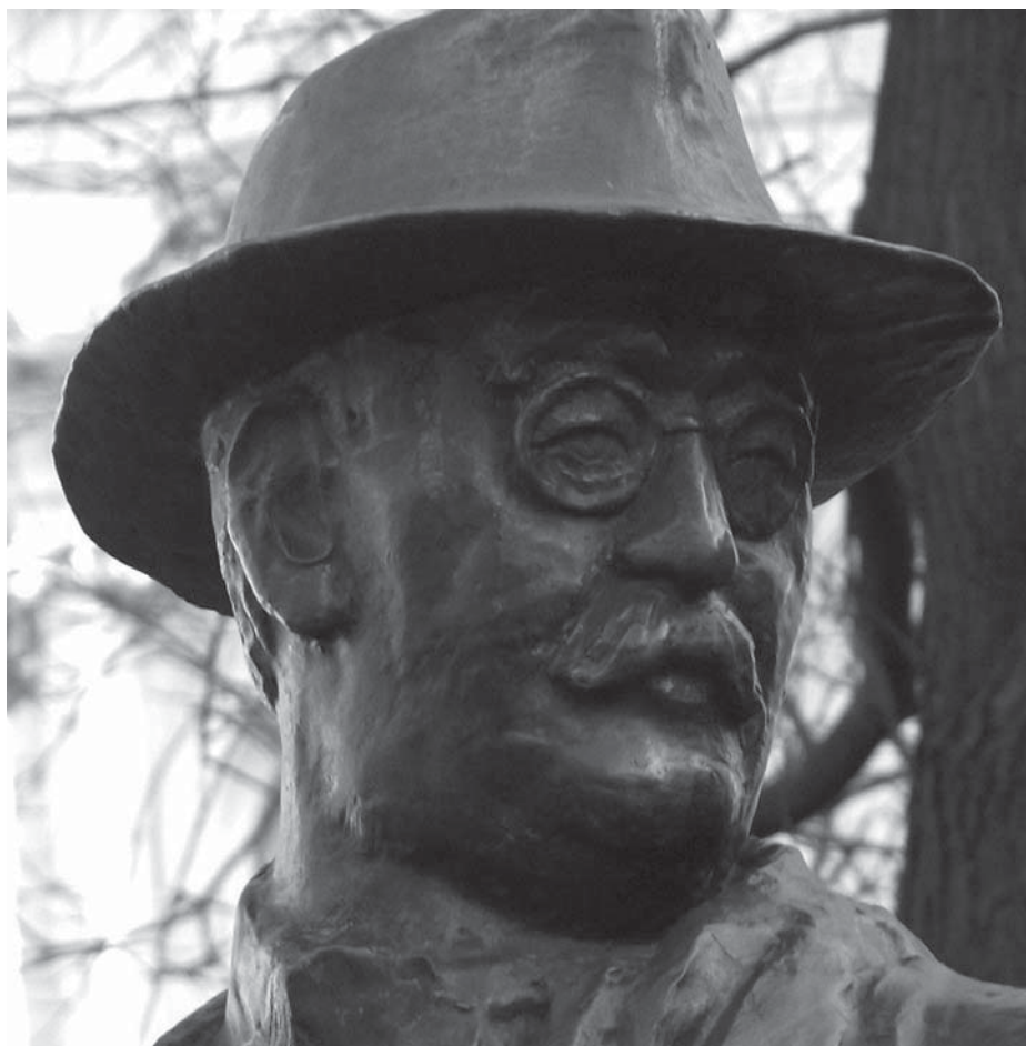
NAGY IMRE SZOBRA BUDAPESTEN

Teljesen hamis, amit Nagy Imre a nemzeti függetlenségről mond. Magyarország független ország volt 1945 előtt is, 1945 után is. Nem kellett a függetlenségért küzdeni, mert az volt. Más volt a helyzet, mondjuk, Vietnámban, amely francia gyarmat volt. Itt a harc egyszerre folyt a függetlenségért és a szocializmusért.