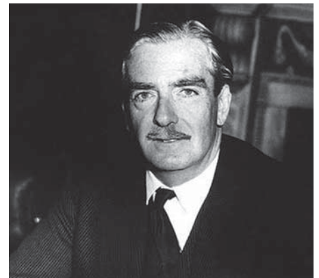
ANTHONY EDEN BRIT MINISZTERELNÖK

Jugoszlávia élén Josip Broz Tito áll, 64 éves. Ő a fasizmus elleni küzdelem hőse, a szocialista Jugoszlávia alapítója. Eltérően a többi európai szocialista