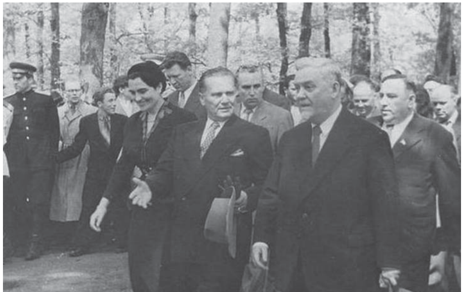
TITO ÉS MALENKOV OROSZ MINISZTERELNÖK 1956-BAN

ország beavatkozhat-e egy másik szocialista ország eseményeibe. Október 30-án még olyan elvi álláspont születik, amely nemet mond a beavatkozásra. Október 31-én az SZKP KB Elnöksége megbízza Hruscsovot és Malenkov miniszterelnököt, hogy tárgyaljanak Titóval. Zsukov honvédelmi miniszter pedig utasítást kap „a magyarországi eseményekkel kapcsolatos intézkedések” kidolgozására. A szovjet vezetés némi ingadozás után úgy dönt, hogy katonai erővel beavatkozik Magyarországon.