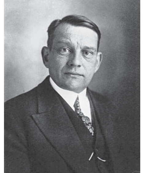
RENÉ COTY FRANCIA ELNÖK

A Kínai Népköztársaság vezetője Mao Ce-tung, a kínai forradalom és felszabadító háború legendás személyisége, ekkor 63 éves. 1949 őszén a polgárháború a kommunista erők győzelmével ért véget. A tőkés kínai csapatok visszavonultak Tajvan