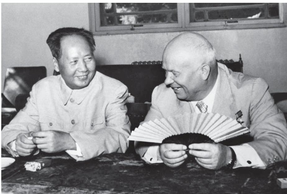
MAO CE-TUNG KÍNAI, ÉS NYIKITA HRUSCSOV SZOVJET VEZETŐ

nemtetszésüket fejezték ki Rákosi iránt. Rákosi távozása után 1956 nyarán a két ország és a két párt viszonya gyorsan javult.