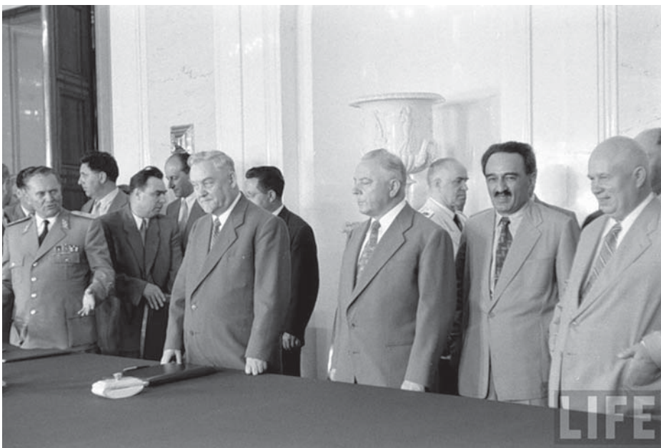
TITO ÉS A SZOVJET VEZETÉS TÖBB TAGJA A KREMLBEN

rút, de jelentős anyagi és emberi árat fizetett érte. A szovjet emberek békére vágytak.