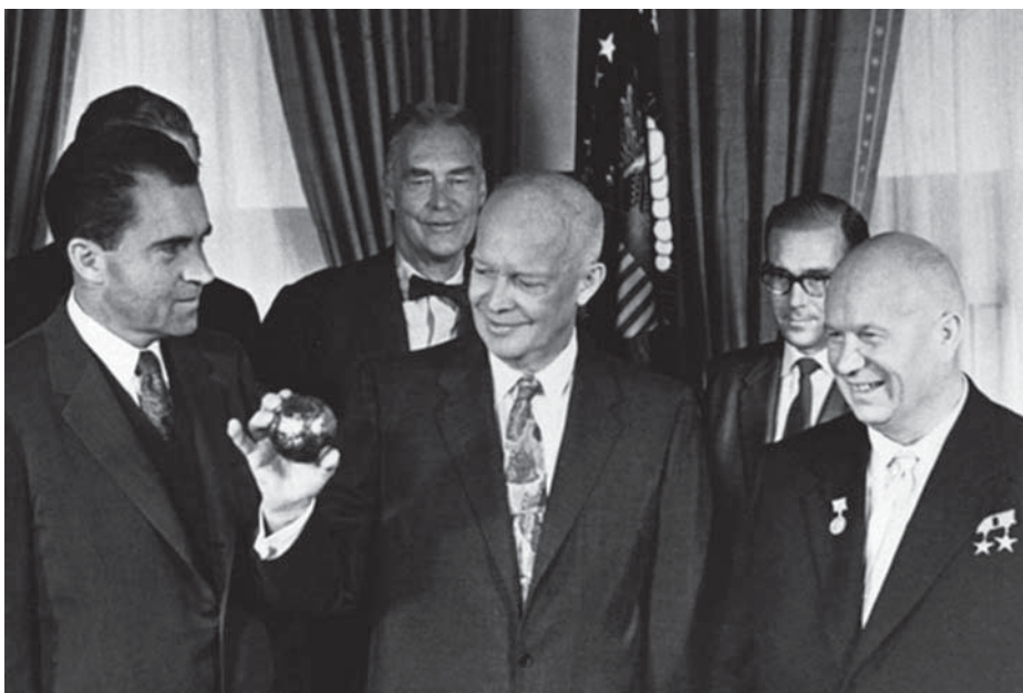
NIXON AMERIKAI ALELNÖK, EISENHOWER ELNÖK ÉS HRUSCSOV

1953-ban Eisenhowernek kell befejezni. Nem nyernek, az eredmény döntetlen. A szovjet és a kínai segítség megakadályozza az amerikaiak és nyugati szövetségeseik győzelmét. A szocialista Észak azonban nem tudja megtartani a déli részeket. Korea mind a mai napig két részből áll, Északon a szocialista KNDK, délen a kapitalista Koreai Köztársaság. Az USA ma is mintegy 29 ezer katonát tart Dél-Koreában, és folyamatos katonai nyomás alatt tartja a KNDK-t.