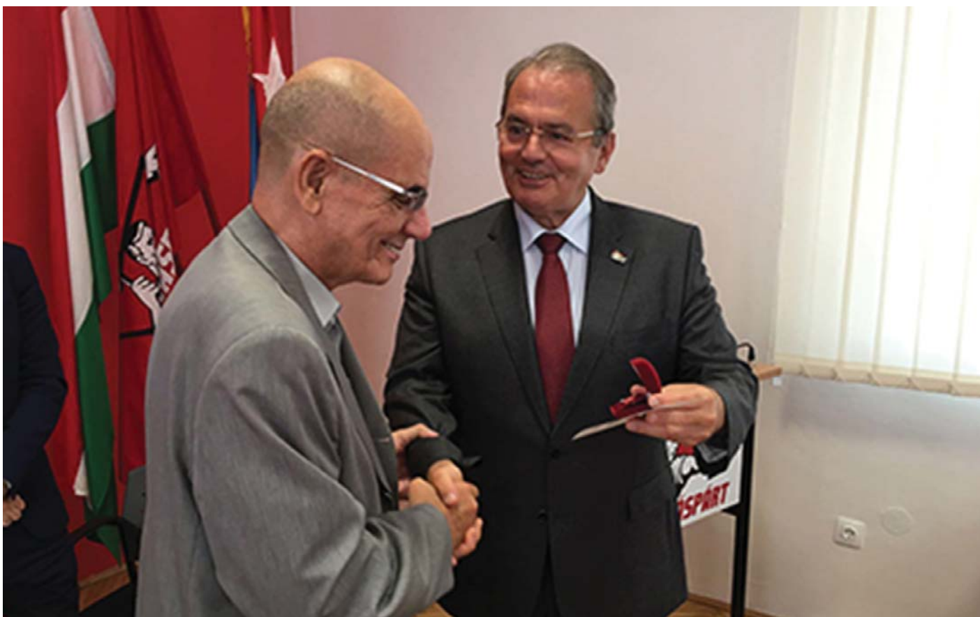
THÜRMER GYULA ÁTADJA A FIDEL CASTRO VÖRÖS LOBOGÓ KITÜNTETÉSÉT A KUBAI NAGYKÖVETNEK