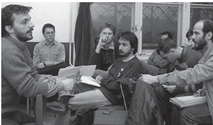
A FIDESZ SZERVEZŐDÉSE A RENDSZERVÁLTÁS ELŐTT

megkülönböztetése, üldözése. Mivel a nyugati taktikája a békés rendszerváltás, 1989-ben nem kerül sor a pártok ostromára, nincs Köztársaság tér.