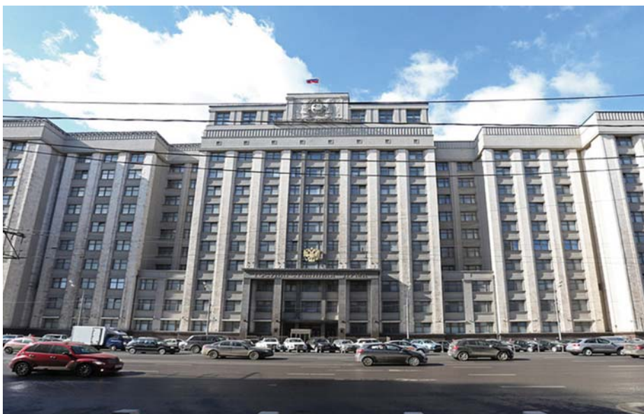
AZ OROSZ PARLAMENT ÉPULETE

A Dumába az országos listán még egy párt jutott be, az Igazságos Oroszország párt 23 helyet kapott. A többi párt nem érte el az 5 százalékos küszöböt. A KPRF-vel szemben konkurensként indított Oroszország Kommunista Pártja