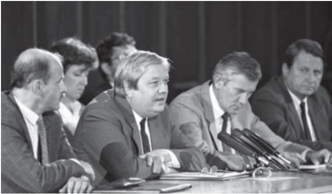
AZ MSZMP VEZETÉSE MŰKÖDÉSKÉPTELENNÉ VÁLIK

megdönteni Magyarországon a szocializmust, és visszaállítani a kapitalizmust.