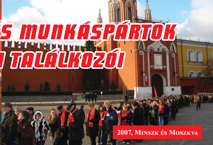
2007, MINSZK ÉS MOSZKVA