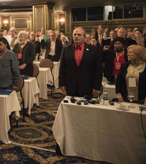
2008, SAO PAULO