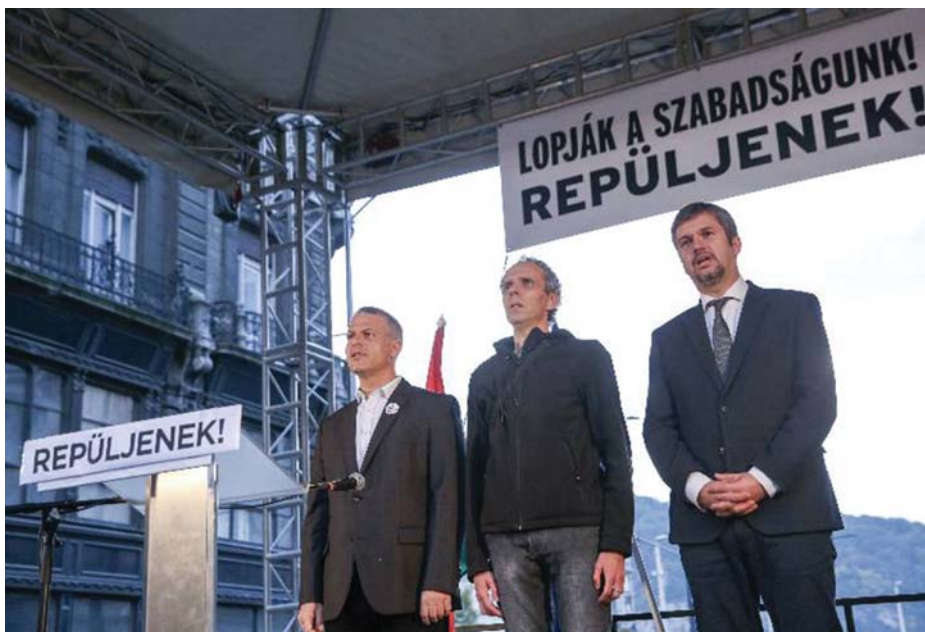
LIBERÁLIS VEZÉRKAR ÖNMAGÁT KERESI

akkor álljon elő vele! Menjen el a bíróságra, tárja a média elé! Konkrétan, tényekkel, meggyőzően! Ha nem tudja, akkor ne butítsa a népet, ne keltsen zavart!