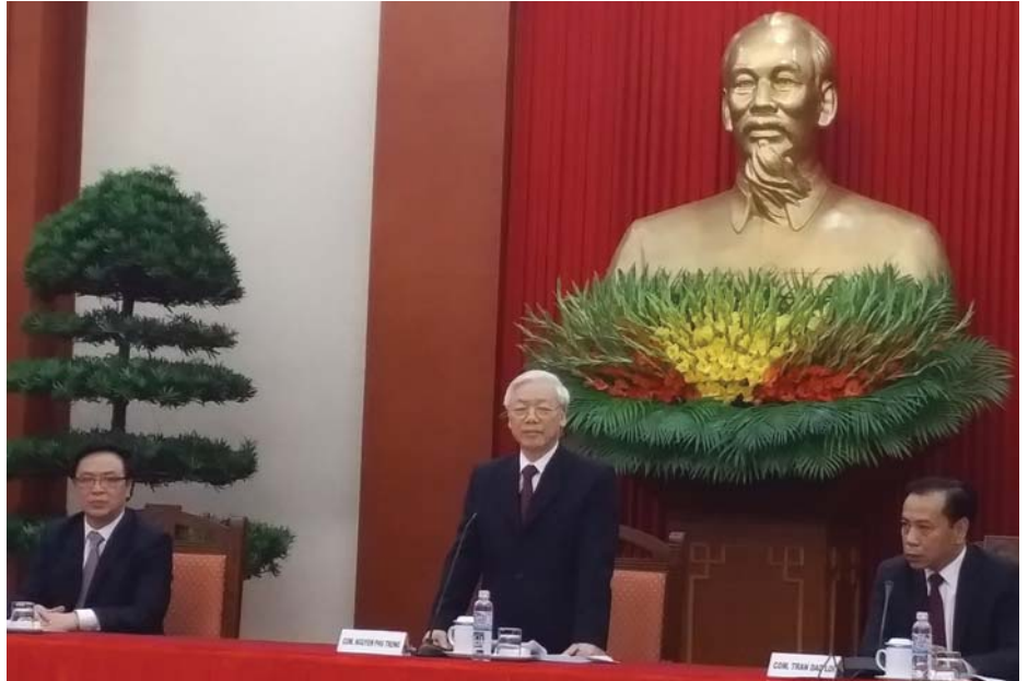
A VIETNAMI KOMMUNISTA PÁRT FŐTITKÁRA FOGADJA A KÜLDÖTTSEGEKET

A 18. Nemzetközi Találkozó közös felhívást fogadott el, amelyet teljes terjedelemben közlünk. ■