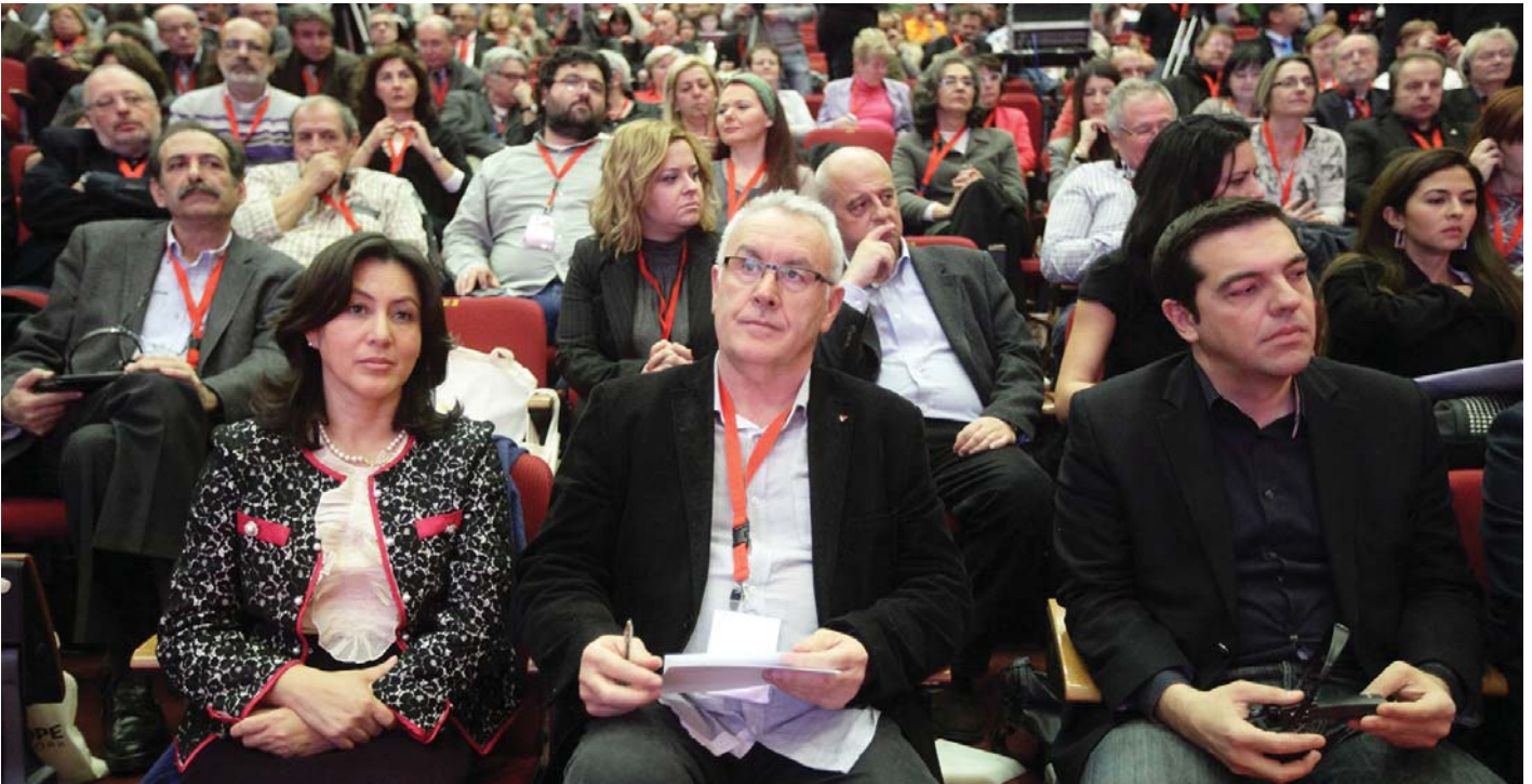
EURÓPA ÁLBALOLDALI VEZETŐI KÖZT CIPRASZ GÖRÖG KORMÁNYFŐ

Így jött létre a Munkáspárt 2006 párt. Ez a párt, amely azóta nevéhez hozzatette az „Európai Baloldal” kifejezést is, objektíve a tőkés erők segédcsapata. Így volt ez a 2016. évi polgármester-választásokon Salgótarjánban is, ahol az MSZP maga mellé vette őket, megtévesztve ezzel sok baloldali embert, hiszen azt a látszatot keltették, mintha az igazi Munkáspárt támogatná az MSZP-t.