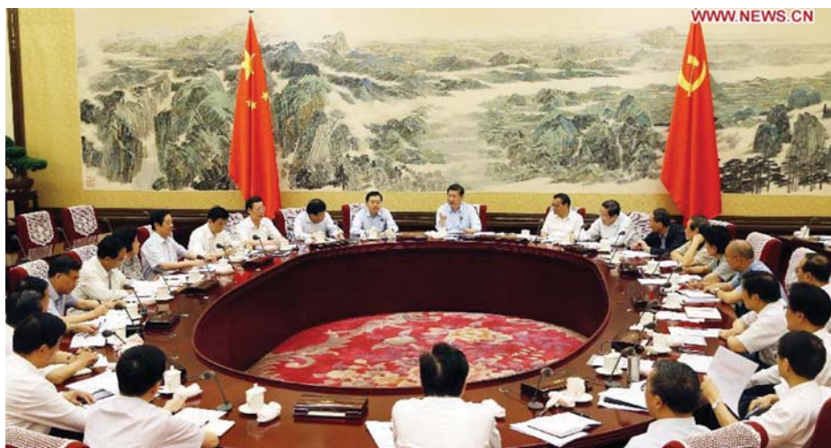
ÜLÉSEZIK A KÍNAI KP POLITIKAI BIZOTTSÁGA

használt négy kínai hieroglifa: 实事求是 (shishi qiushi). Ezek a kifejezések mind a mai napig jellemzik a KKP gondolkodását.