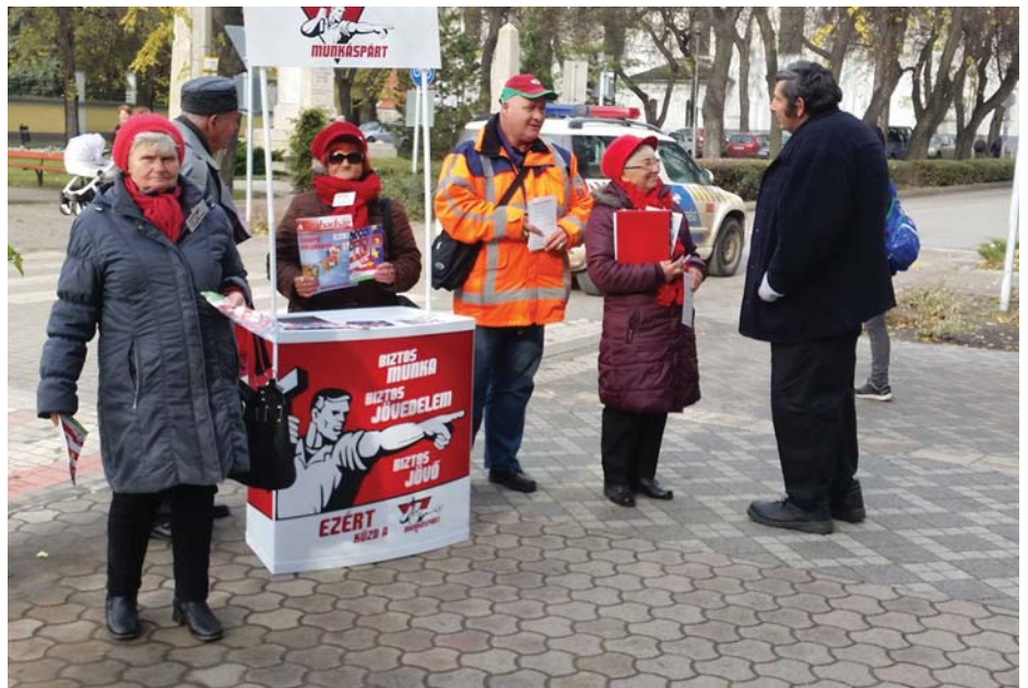
TILTAKOZÓ GYŰLÉS BÁCS-KISKUN MEGYÉBEN

gyobb akadályokba ütköztünk. A tanulság az, hogy mindenütt erősíteni kell a Munkáspártot.