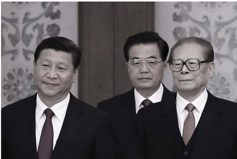
A KÍNAI KP JELENLEGI ÉS KÉT KORÁBBI FŐTITKÁRA

„A kongresszus egyhangúlag elfogadta, hogy a szervezeti szabályzat a párt fő irányvonalaként a marxizmus-