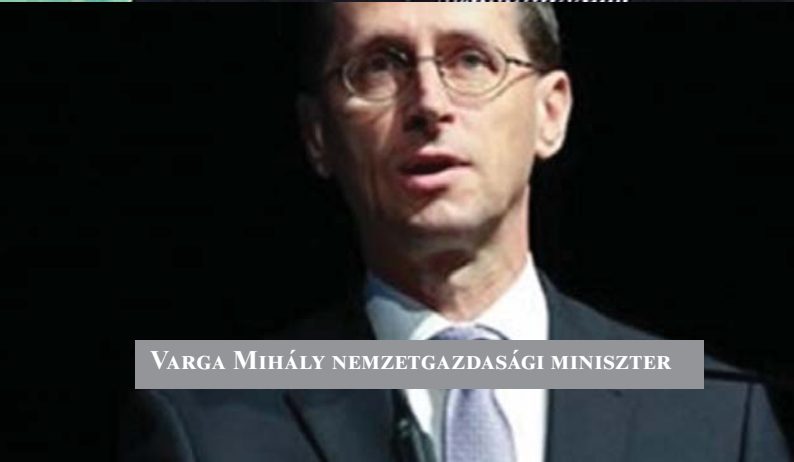
VARGA MIHÁLY NEMZETGAZDASÁGI MINISZTER

A kormány, a szakszervezetek és a munkaadói szervezetek megállapodtak, hogy a minimálbér 15, a garantált bérminimum 25 százalékkal nő 2017-ban, a munkáltatói járulékok 5 százalékponttal csökkennek, majd 2018-ban a minimálbér újabb 8, a bérminimum 12 százalékkal emelkedik, a járulékok pedig 2 százalékponttal csökkennek. A bérmegállapodást a Munkaadók és Gyáriparosok Országos Szövetségének, a Vállalkozók Országos Szövetségének, az ÁFEOSZ-COOP Szövetségnek, a Független Szakszervezetek Demokratikus Ligájának, a Magyar Szakszervezeti Szövetségnek, a Munkástanácsok Országos Szövetségének képviselői fogadták el, a Stratégiai és Közszolgáltató Társaságok Országos Szövetségének, a Magyar Kereskedelmi és Iparkamarának, a Szakszervezetek Együttműködési Fórumának és az Értelmiségi Szakszervezeti Tömörülésnek a képviselői pedig egyetértésüket fejezték ki.