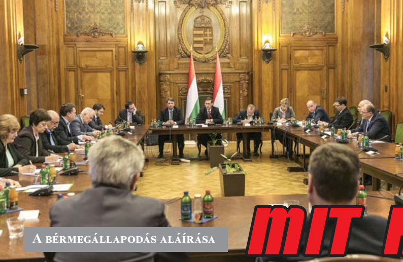
A BÉRMEGÁLLAPODÁS ALÁÍRÁSA