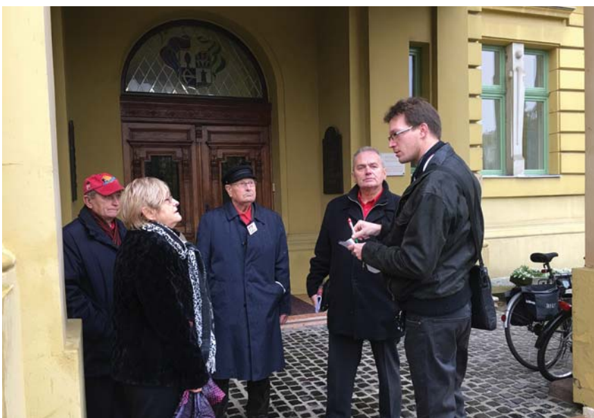
THÜRMER GYULA SAJTÓTÁJÉKOZTATÓJA NYÍREGYHÁZÁN