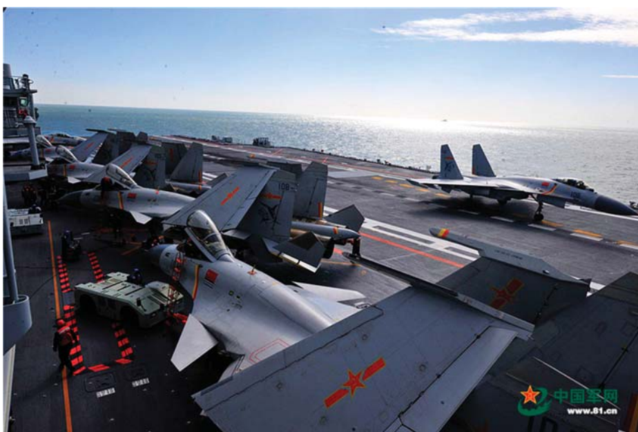
A KÍNAI HADIIPAR KORSZERŰ TERMÉKEI

meghirdette a Nagy Ugrás politikáját, a fejlődés radikális felgyorsítását. Teng ezt így jellemezte később: „1957 második felében harcot hirdettünk a jobboldali elhajlók ellen. Ez abban az időben szükséges lépés volt. Azonban túl messze mentünk, túl sok ember lett a harc célpontja, ez viszont hiba volt. Ezt követte a Nagy Ugrás és a népi kommunák mozgalma 1958-tól, ami teljes mértékben összeegyeztethetetlen volt az objektív körülményekkel, eltértünk az iránytól és túl gyorsan akartunk fejlődni. Gyakorlatilag 1957 második felétől, a párt VIII. Kongresszusától kezdődött ez, és ez a »baloldali« elhajlás eltartott egészen 1976-ig, közel 20 évig. A »baloldali« elhajlás csúcspontja a »kulturális forradalom« volt.”