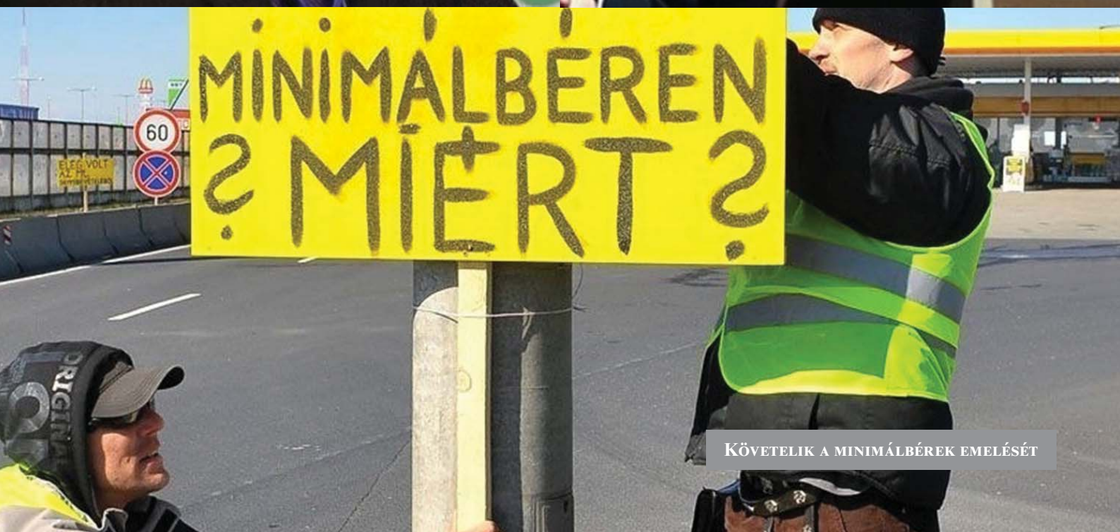
KÖVETELIK A MINIMÁLBÉREK EMELÉSÉT

A kormány, a szakszervezetek és a munkaadói szervezetek megállapodtak, hogy a minimálbér 15, a garantált bérminimum 25 százalékkal nő 2017-ban, a munkáltatói járulékok 5 százalékponttal csökkennek, majd 2018-ban a minimálbér újabb 8, a bérminimum 12 százalékkal emelkedik, a járulékok pedig 2 százalékponttal csökkennek. A bérmegállapodást a Munkaadók és Gyáriparosok Országos Szövetségének, a Vállalkozók Országos Szövetségének, az ÁFEOSZ-COOP Szövetségnek, a Független Szakszervezetek Demokratikus Ligájának, a Magyar Szakszervezeti Szövetségnek, a Munkástanácsok Országos Szövetségének képviselői fogadták el, a Stratégiai és Közszolgáltató Társaságok Országos Szövetségének, a Magyar Kereskedelmi és Iparkamarának, a Szakszervezetek Együttműködési Fórumának és az Értelmiségi Szakszervezeti Tömörülésnek a képviselői pedig egyetértésüket fejezték ki.