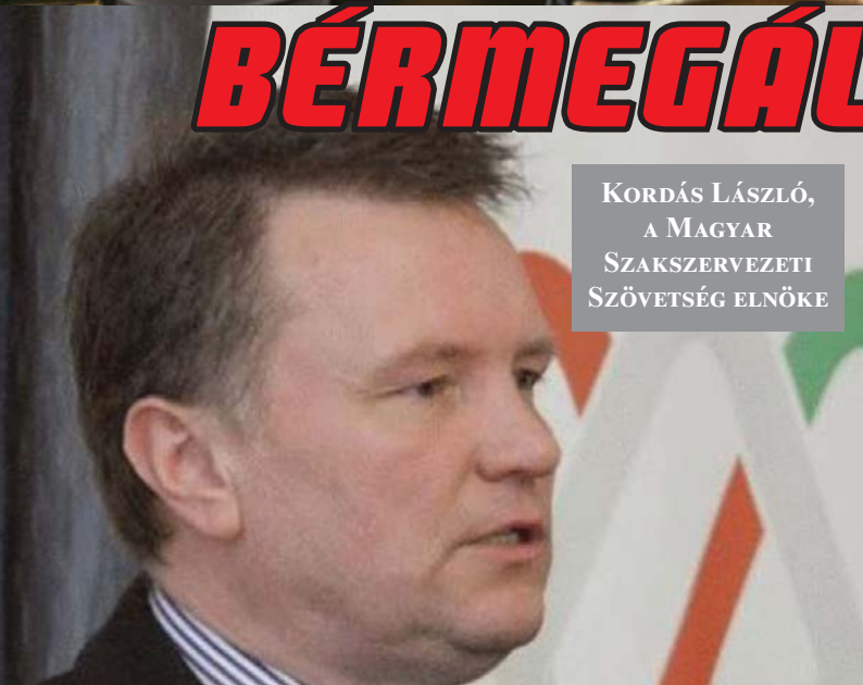
KORDÁS LÁSZLÓ, A MAGYAR SZAKSZERVEZETI SZÖVETSÉG ELNÖKE