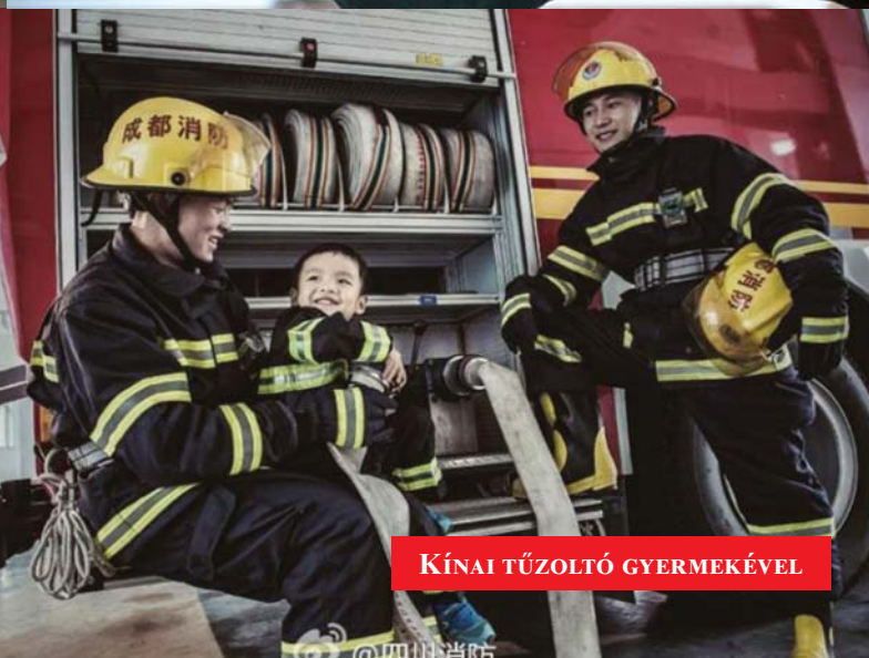
KÍNAI TŰZOLTÓ GYERMEKÉVEL