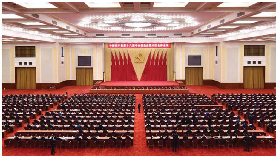
ÜLÉSEZIK A KÍNAI KP KÖZPONTI BIZOTTSÁGA

6. A sikeres gazdaságpolitika elengedhetetlen feltétele a kommunista párt vezető szerepének érvényesítése.