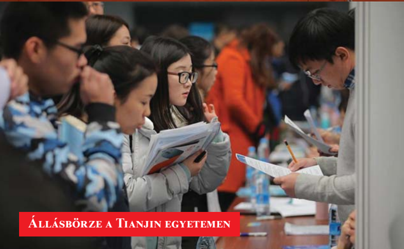
ÁLLÁSBOZRE A TIANJIN EGYETEMEN