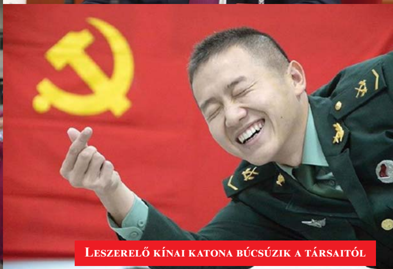
LESZERELŐ KÍNAI KATONA BÚCSÚZIK A TÁRSAITÓL