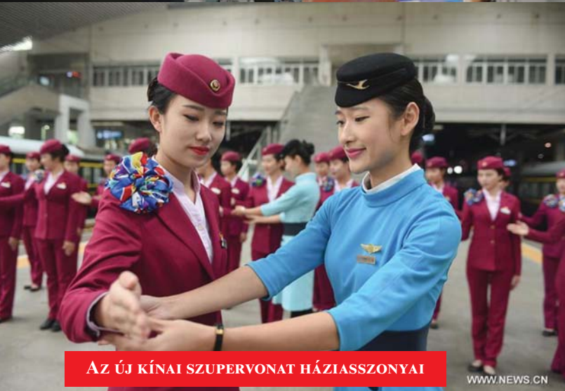
AZ ÚJ KÍNAI SZUPERVONAT HÁZIASSZONYAI