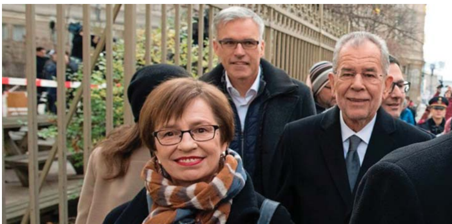
AZ ÚJ OSZTRÁK ELNÖK KÍSÉRETÉVEL

Az osztrák kapitalizmus is válságban van. Az osztrákok jobban élnek, mint mi, magyarok, de rosszabbul élnek, mint 10 éve. A válságra sem a konzervatívok, sem a szociáldemokraták nem tudnak korszerű, általánosan elfogadható választ