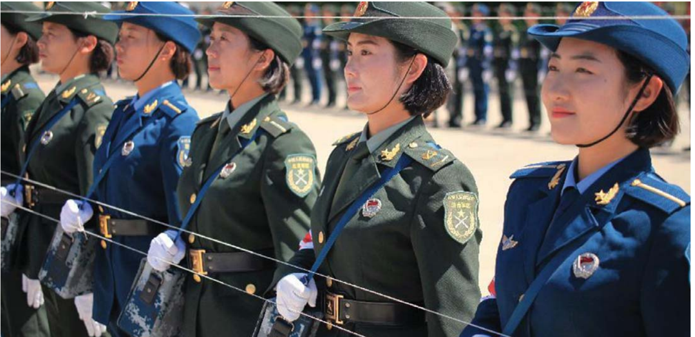
A KÍNAI HADSEREG A SZOCIALIZMUST VÉDI

A kínai sajátosságú szocializmus politikai gazdaságtanában akkor jelennek meg az új fogalmak. A társadalmi tulajdon megjelenhet össznépi tulajdon és csoportos tulajdon formájában. A társadalmi tulajdon mellett létezik egyéni gazdálkodó tulajdona, magántőke vállalkozása, külföldi beruházás. A különböző tulajdonformák egyenjogúak és huzamos ideig fenn fognak állni.