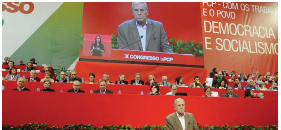
JERÓNIMO DE SOUSA FŐTITKÁR BESZÉDET MOND A KONGRESSZUSON

alternatíva pedig a szocializmus. A termelő erők fejlődése megteremti a szocialista forradalom objektív feltételeit, de a kapitalizmus leváltása, és a szocializmus megteremtése nem automatikusan megy végbe. A kongresszus kiemelte, hogy az 1917-es Nagy Októberi Szocialista Forradalom eszméi mai is élnek és tapasztalatai fontos utmutatók a tömegek harcában.