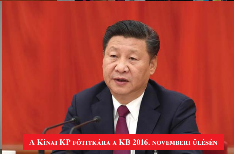
A KÍNAI KP FŐTITKÁRA A KB 2016. NOVEMBERI ÜLÉSÉN