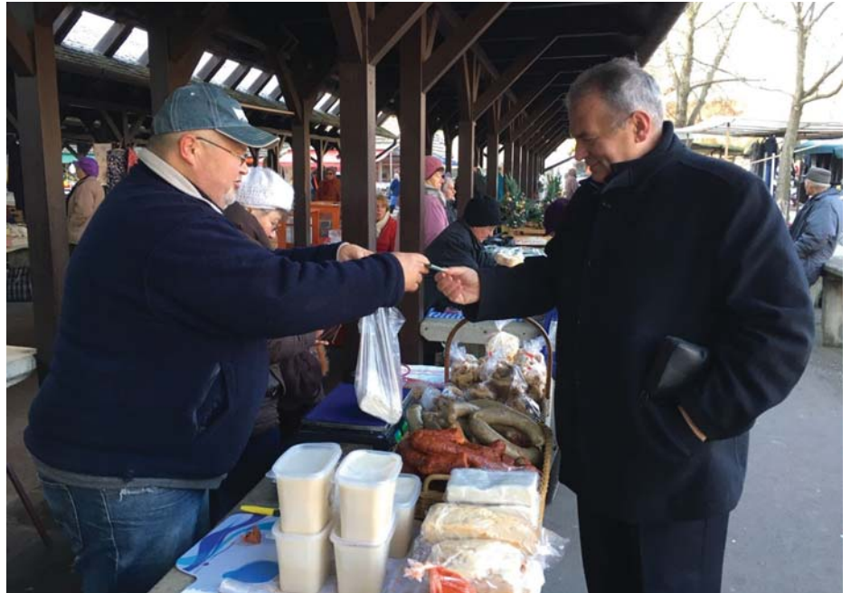
RÉGI ISMERŐSÖK A MAKÓI PIACON