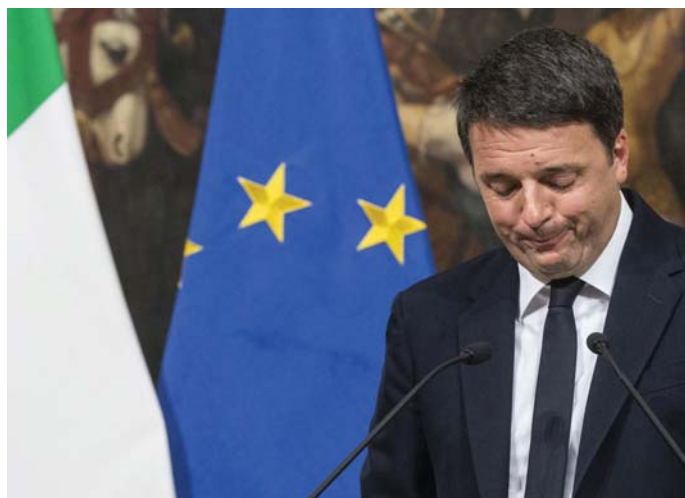
RENZI BUKOTT OLASZ MINISZTERELNÖK

A kapitalizmus válsága sújtja Olaszországot is. Az olaszok most a rendtelenség fenntartását választották a nagyobb rend helyett. A válság leküzdésére több lehetőséget látnak abban, hogy halászhatnak a zavarosban, mint sem, hogy változtassanak a hagyományos intézményeken. Evvel persze nincsenek előbbre. Előre a válság útján!