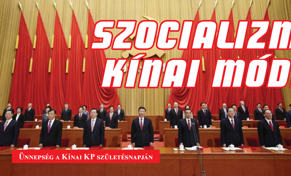
ÜNNEPSÉG A KÍNAI KP SZÜLETÉSNAJÁN