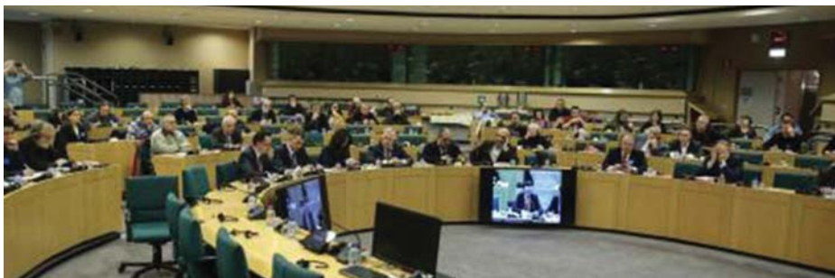
KOMMUNISTA TANÁCSKOZÁS AZ EURÓPAI PARLAMENTBEN

megváltozni, ha legyőzzük a kapitalizmust, megteremtjük azt a társadalmat, ahol nem a pénz, hanem az ember érdeke a döntő. A tőkés rendszer nem tudja megoldani válságát, és ez egyre inkább veszélybe sodorja Európa népeit. A megoldás Európa számára nem az EU ilyen-olyan átalakítása, hanem a kapitalizmus felszámolása, a szocializmus megteremtése.