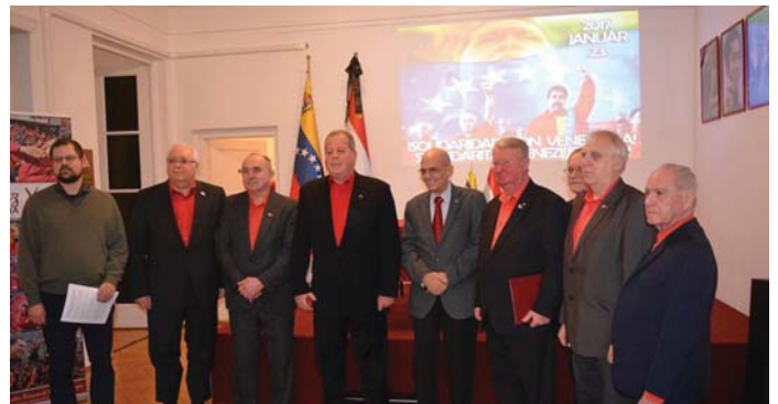
SZOLIDARITÁS VENEZUELA MELLETT

Ezért vagyunk szolidárisak Venezuela népével. Ezért vagyunk ma itt, ezért hoztuk magunkkal a Magyar Munkáspárt legforróbb üdvözlétét.