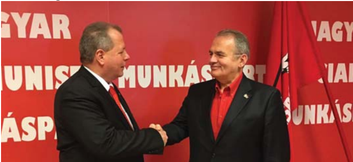
A VENEZUELA NAGYKÖVET LÁTOGATÁSA A MUNKÁSPÁRTBAN