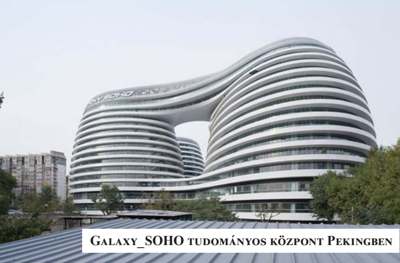
GALAXY_SOHO TUDOMÁNYOS KÖZPONT PEKINGBEN