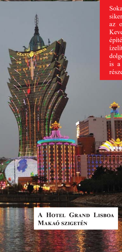
A HOTEL GRAND LISBOA MAKAÓ SZIGETÉN

Sokat hallunk Kína gazdasági sikereiről. Olvasunk a tudományban, az oktatásban elért eredményekről. Keveset tudunk azonban a mai kínai építészetéről. Ebből adunk most ízelítőt. Nem csak azért, mert szép dolgokat látunk, hanem mert ezek is a kínai sajátosságú szocializmus részei.