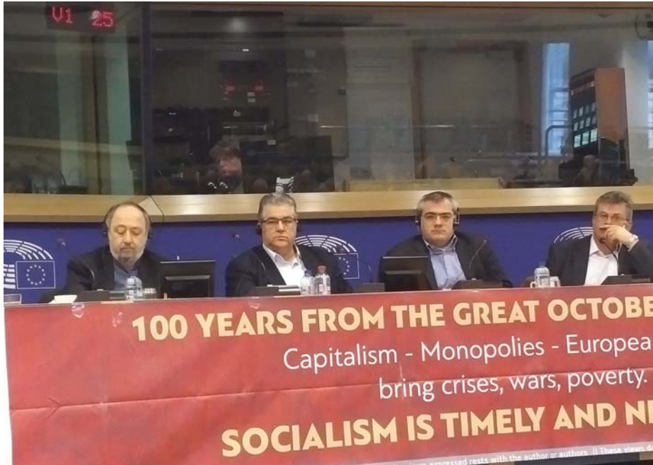
A GÖRÖG KP VEZETŐI A TANÁCSKOZÁSON

Január 23-án Brüsszelben megrendezték az európai kommunista pártok találkozóját. Az első ilyen rendezvényre tíz évvel ezelőtt került sor a Görög Kommunista Párt kezdeményezésére, és az ő szervezésükben. A találkozó házigazdája ezúttal is a Görög KP volt. A mostani találkozón 42 kommunista párt vett részt.