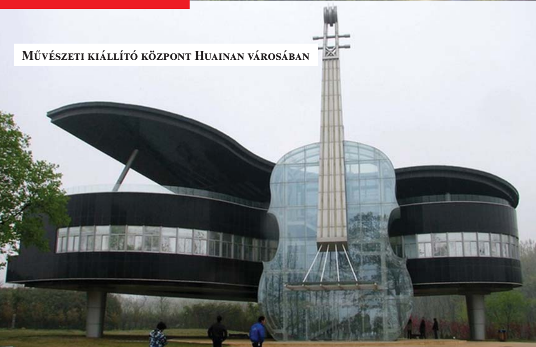
MŰVÉSZETI KIÁLLÍTÓ KÖZPONT HUAINAN VÁROSÁBAN