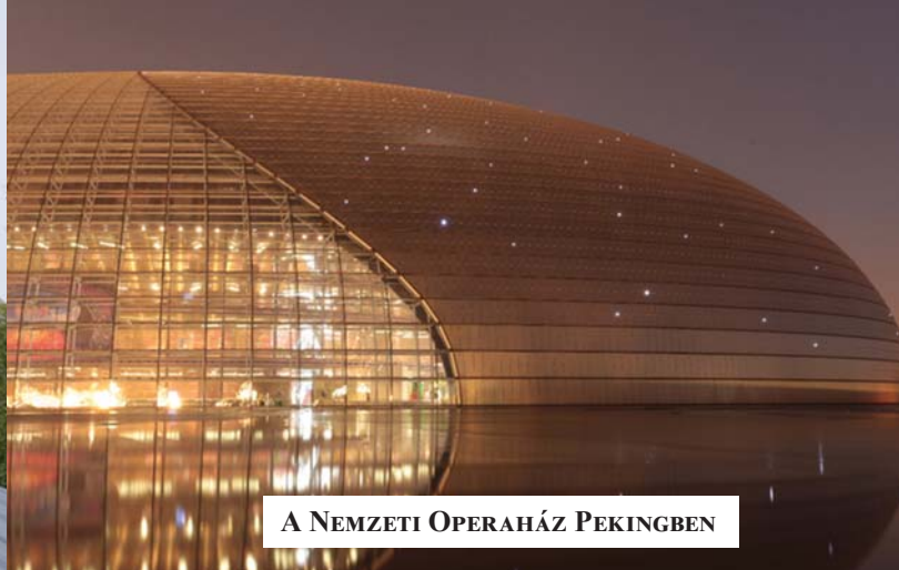
A NEMZETI OPERAHÁZ PEKINGBEN