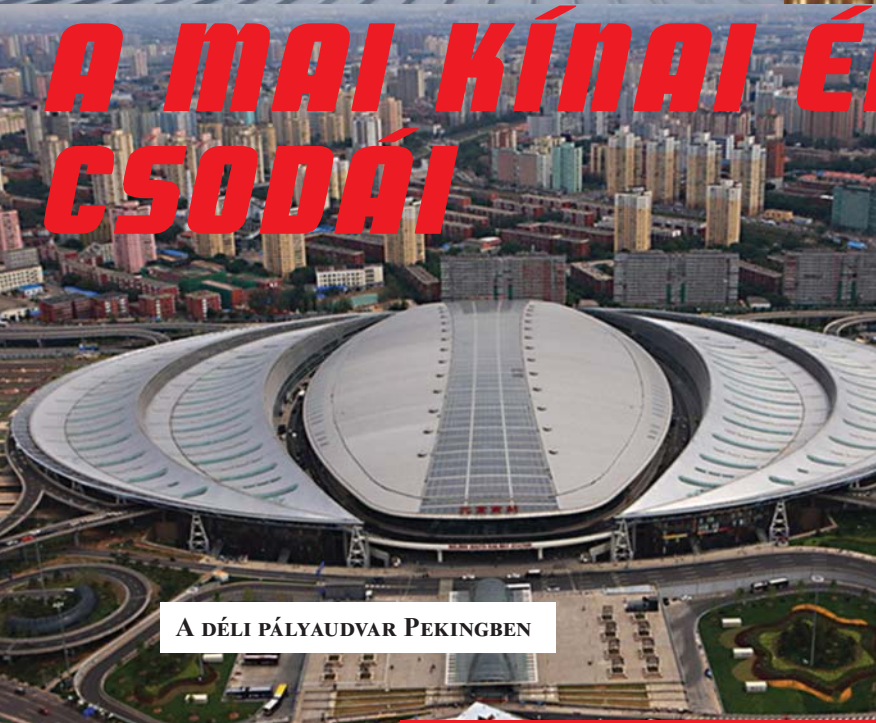
A DÉLI PÁLYAUDVAR PEKINGBEN