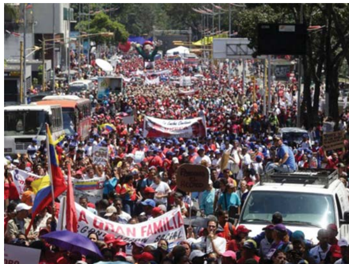
VENEZUELAI FIATALOK A KORMÁNYT TÁMOGATJÁK